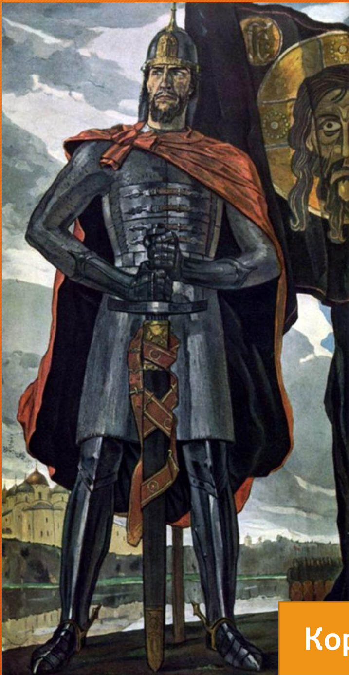
Корин. Александр Невский