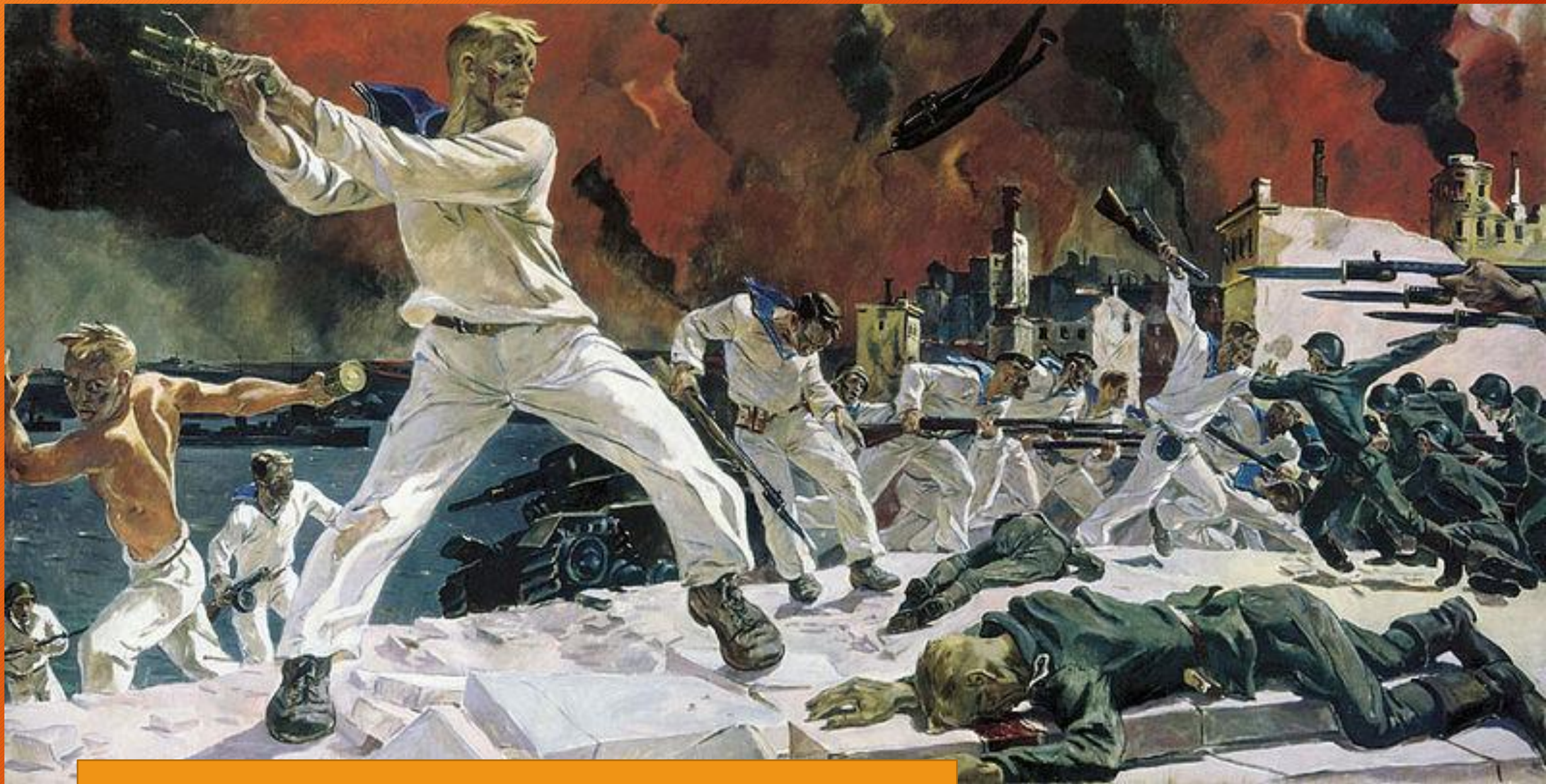
Дейнека. Оборона Севастополя