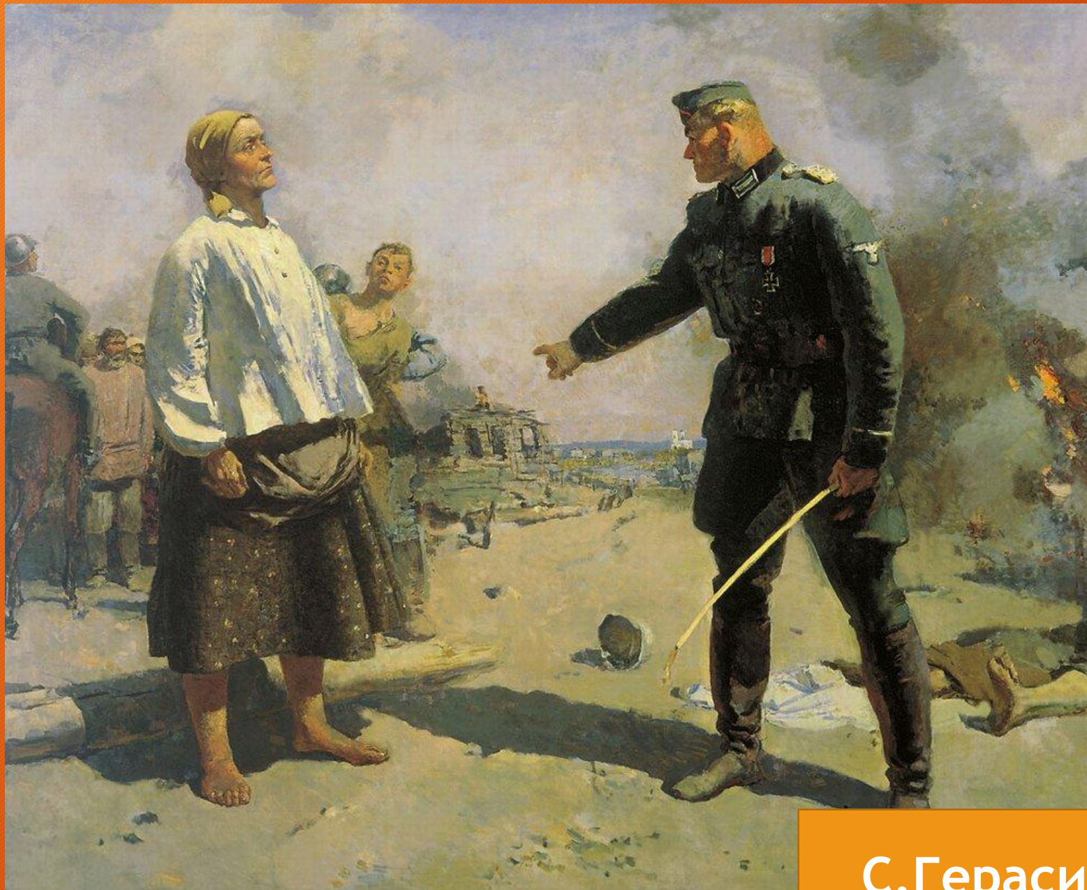
С.Герасимов. Мать Партизана