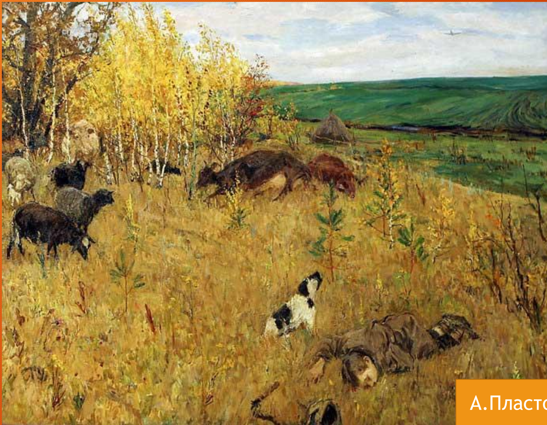
А.Пластов. «Фашист пролетел»