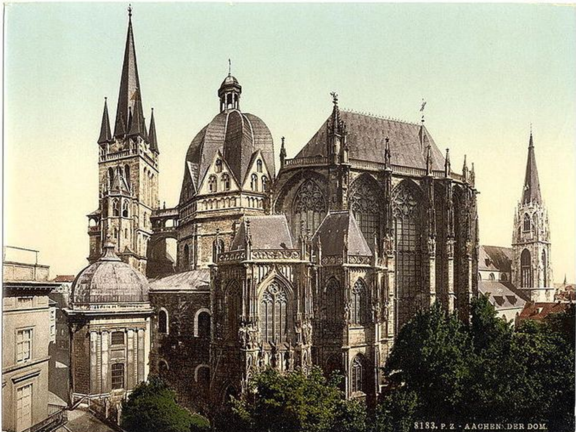
8183. P. Z. - AACHEN. DER DOM.