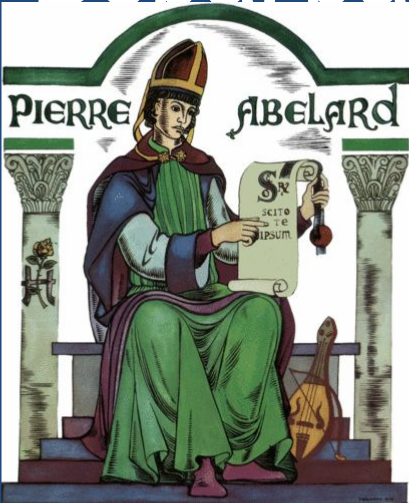
Пьер Абельяр французский философ, богослов и поэт

Сомнение признается философом началом всякого знания. Абельяр стремится понять то, во что верит. Он был самым известным из всех преподавателей парижских школ.