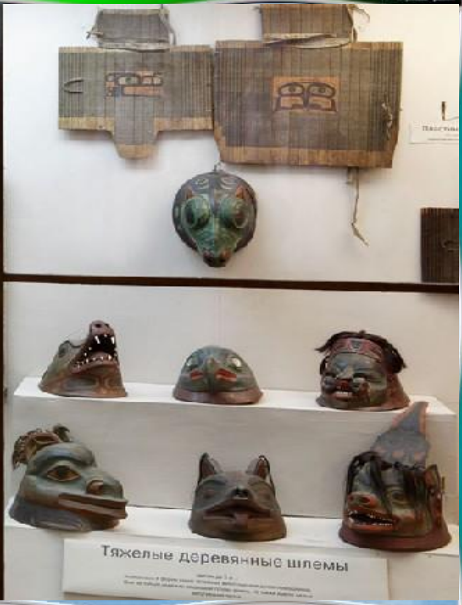
Тяжелые деревянные шлемы Музей истории культуры народов России ул. Мещинская, 15 125080 Москва