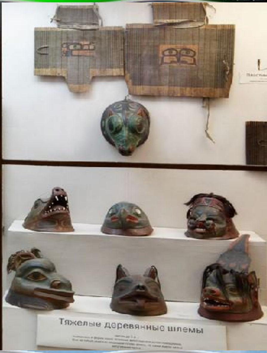
Тяжелые деревянные шлемы Музей этнографии Музей истории Музей культуры Музей искусства