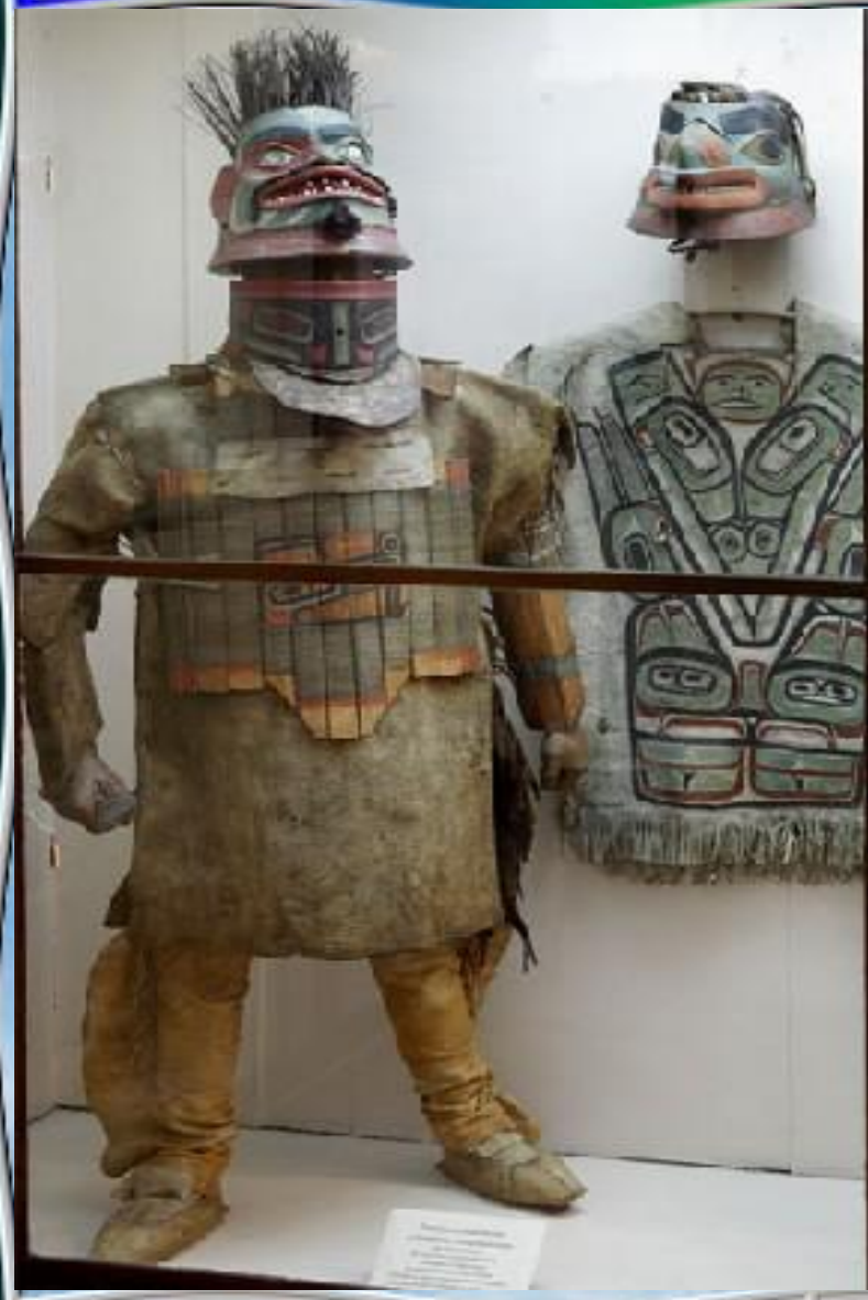
Музей этнографии Музей истории Музей культуры Музей искусства