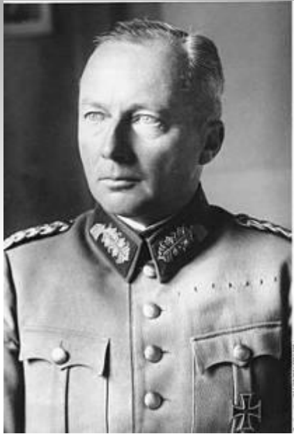
генерал-фельдмаршал Гюнтер Ханс фон Клюге (группа армий «Центр»)