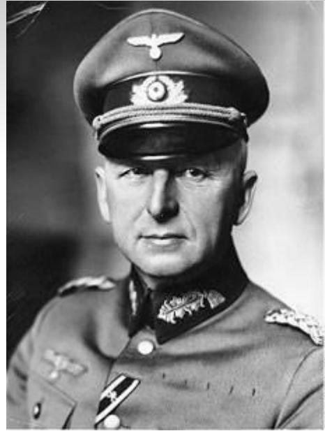
генерал-фельдмаршал Фриц Эрих фон Маништейн (группа армий «Юг»)