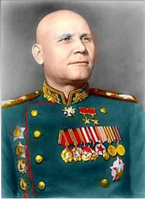
командующий генерал-полковник Иван Конев