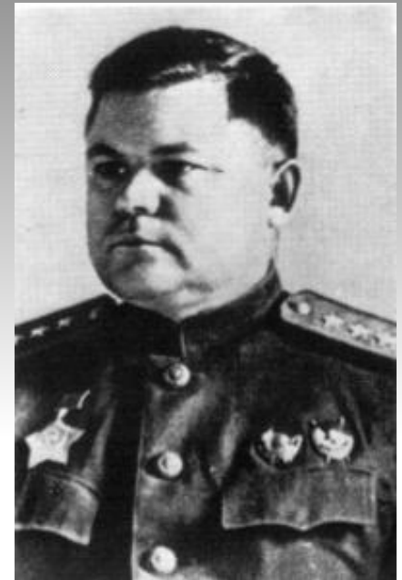
генерал армии Николай Ватутин