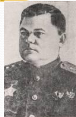
Н.Ф. Ватулин, командующий Воронежским фронтом