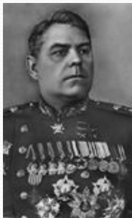
Василевский А.М., представитель Ставки