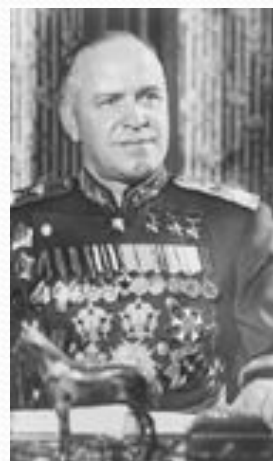
Жуков Г.К. представитель Ставки