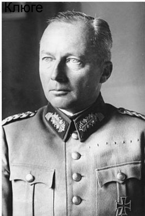
Гюнтер Ханс фон Клюге