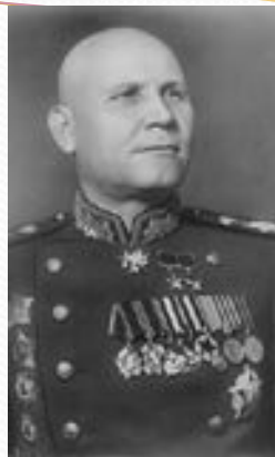
Конев И. С., командующий Степным фронтом