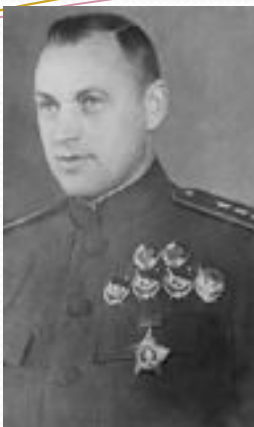
Рокоссовский К.К., командующий Центральным фронтом