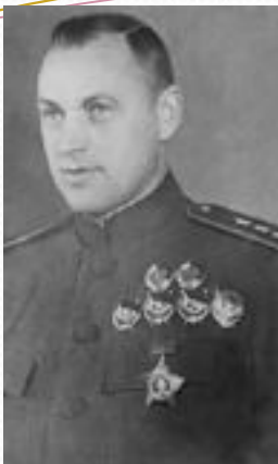
Рокоссовский К.К., командующий Центральным фронтом