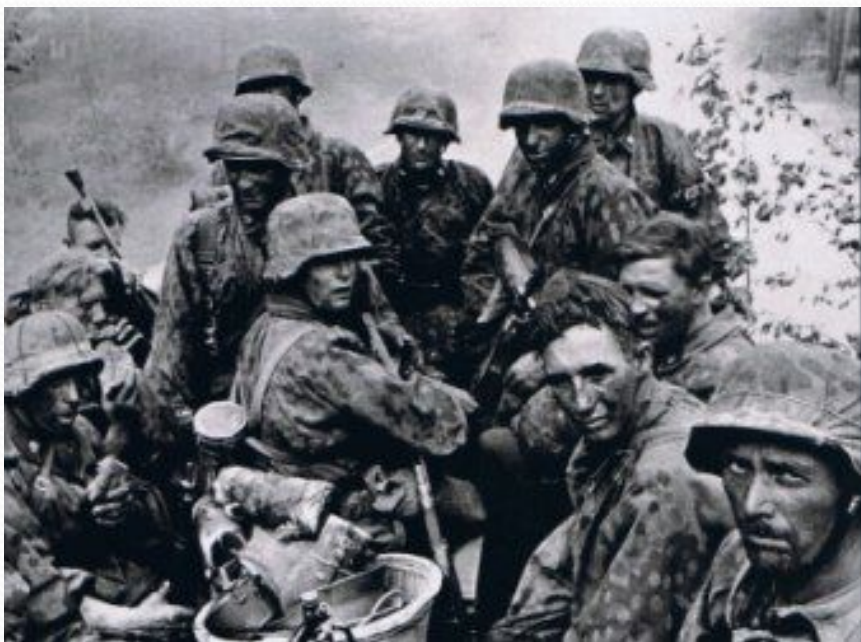
Фото немецких танков и солдат перед началом Курской битвы