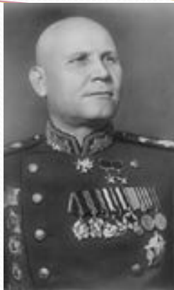
Конев И. С., командующий Степным фронтом