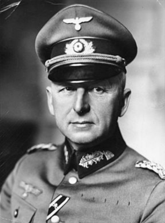
Эрих фон Манштейн