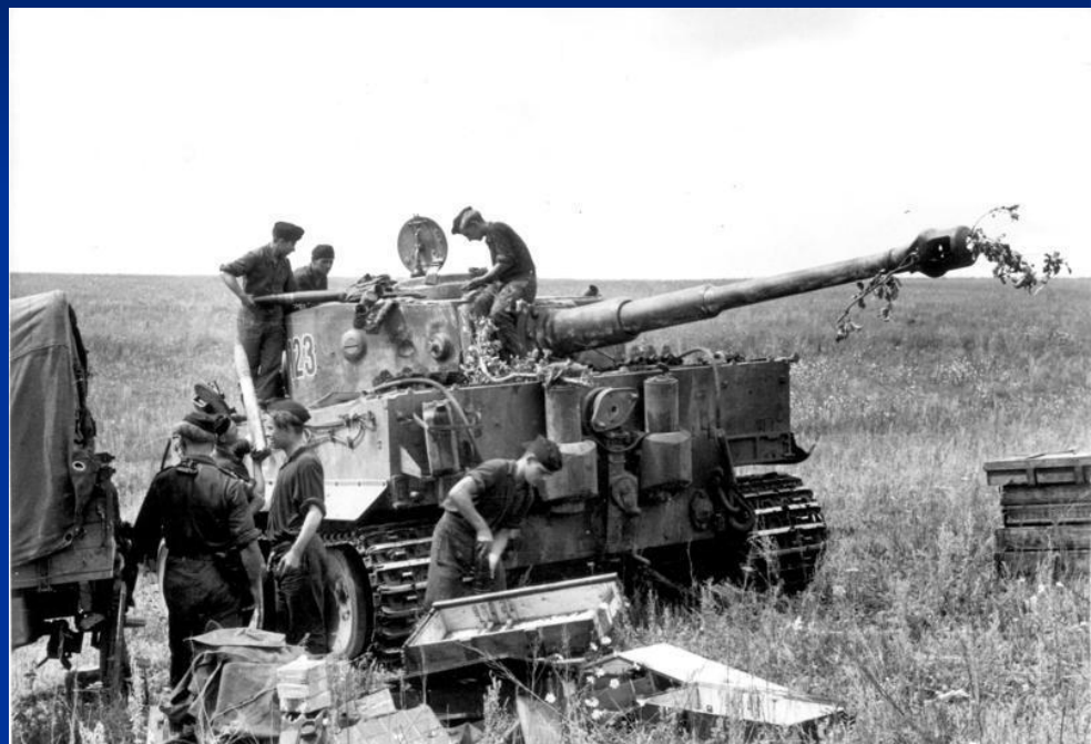
1943 Sommer