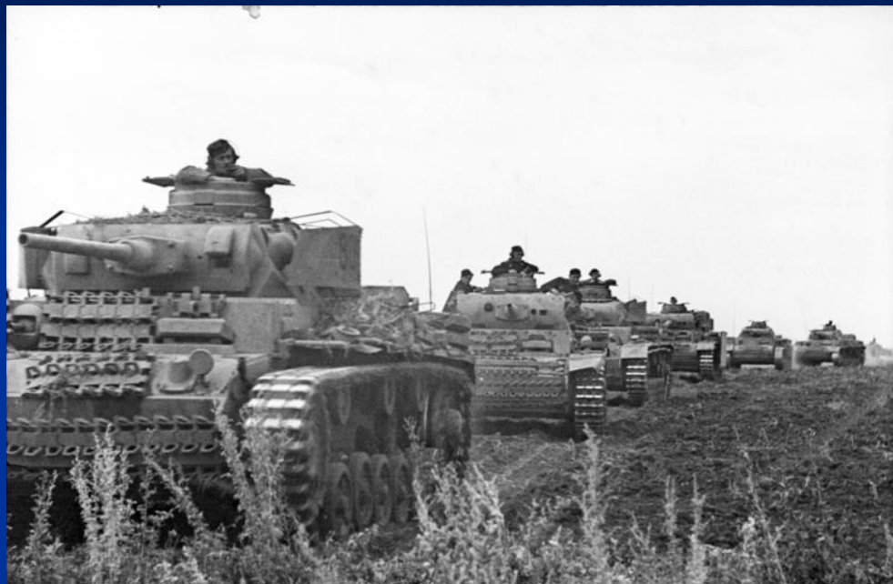
1943 Juni - Juli