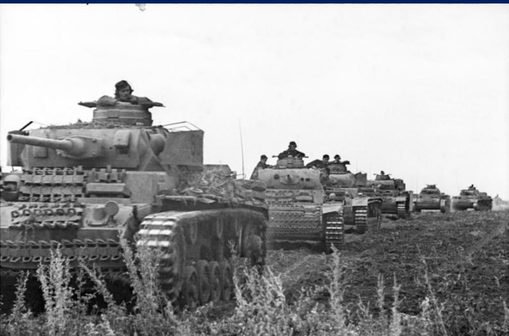
1943 Juni - Juli

Германское наступление началось утром 5 июля 1943 года. Поскольку советскому командованию было точно известно время начала операции — 3 часа ночи (немецкая армия воевала по Берлинскому времени — в переводе на московское 5 часов утра), в 22:30 и в 2:20 по московскому времени силами двух фронтов была проведена контрартподготовка количеством боеприпасов 0.25 боекомплекта. В немецких докладах отмечены значительные повреждения линий связи и незначительные потери в живой силе. Также был произведен неудачный авиационный налет силами 2-й и 17-й воздушных армий (более 400 штурмовиков и истребителей) на Харьковский и Белгородский аэроузлы противника.