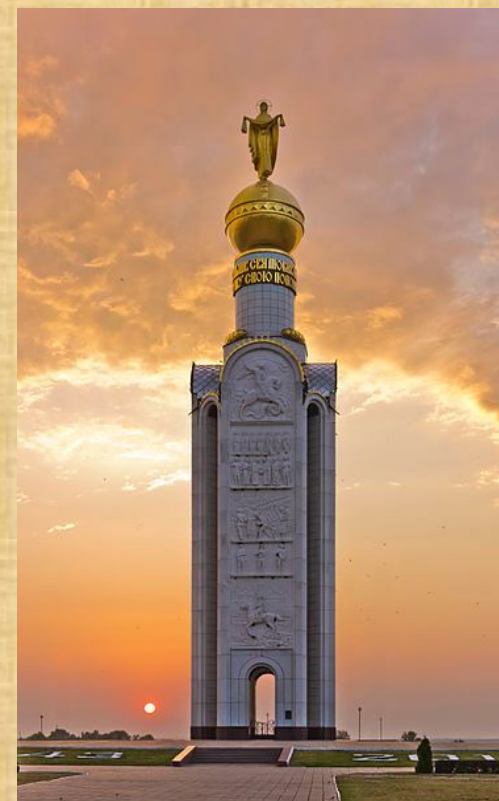
Звонница в память о погибших на Прохоровском поле