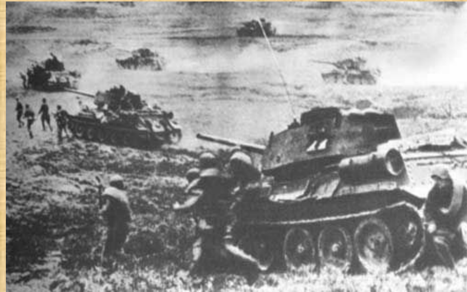
Сражение под Прохоровкой