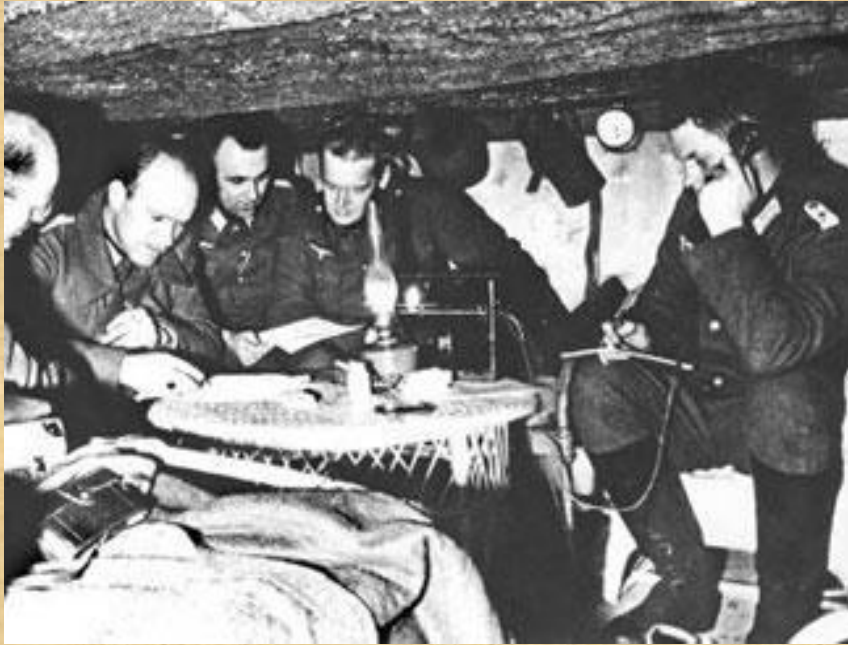
Немецкие офицеры над разработкой операции «Цитадель»

Окончательно похоронило гитлеровскую операцию "Цитадель" крупнейшее за всю вторую мировую войну встречное танковое сражение под Прохоровкой. Оно произошло 12 июля. В нем с обеих сторон одновременно участвовали 1200 танков и самоходных орудий. Это сражение выиграли советские воины. Фашисты, потеряв за день боя до 400 танков, вынуждены были отказаться от наступления.