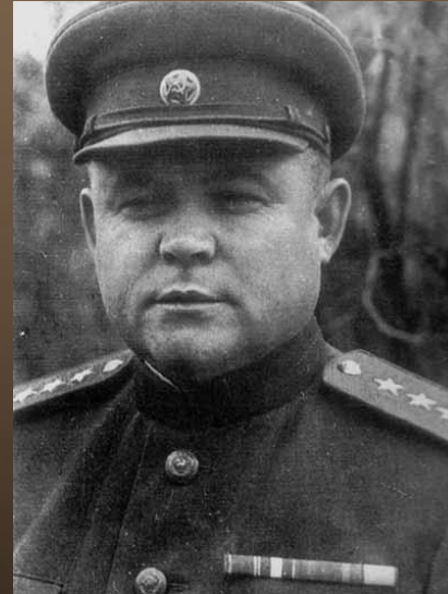
Н. Ф. Ватутин