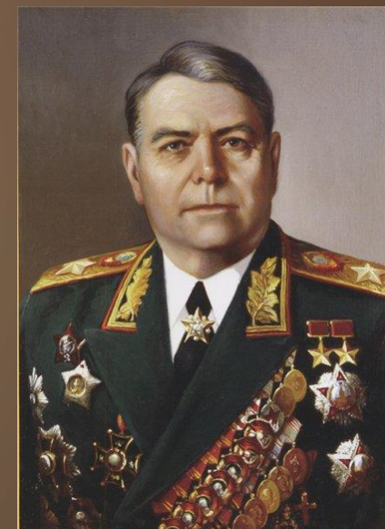
А. М. Василевский