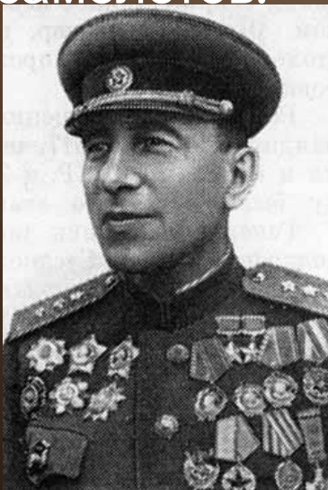
М. Е. Катуков