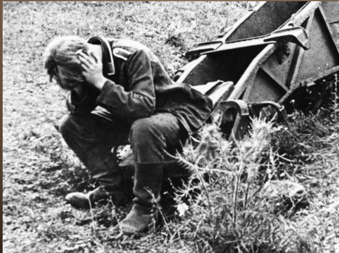
Немецкий солдат у разбитого орудия.