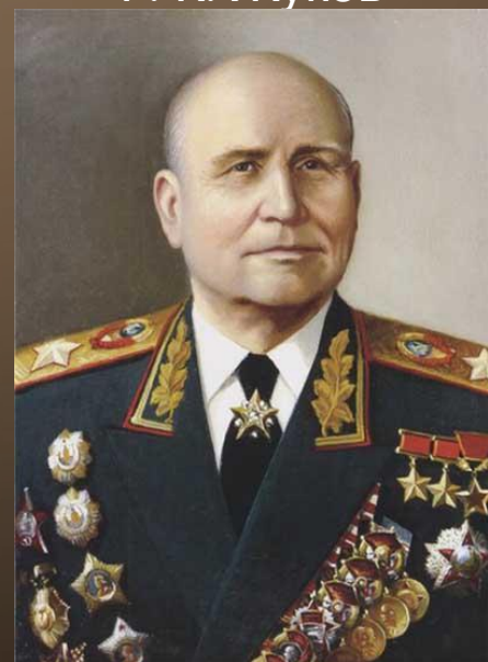
И. С. Конев