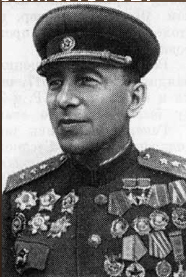
М. Е. Катуков