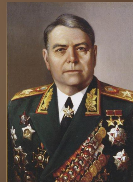
А. М. Василевский