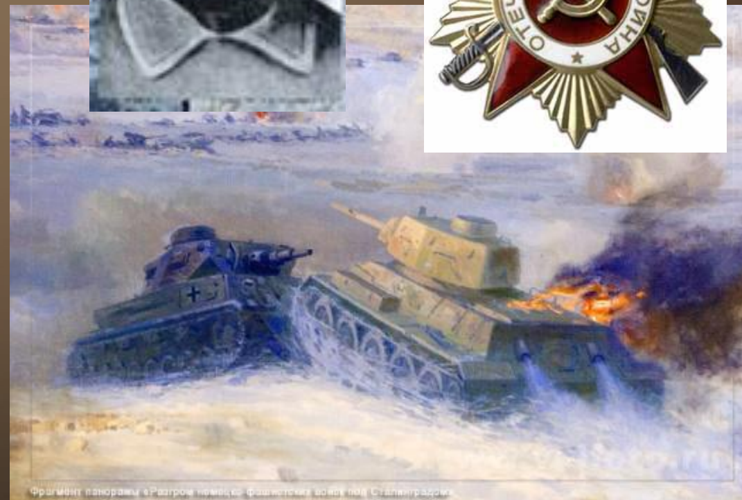
Фрагмент панорамы «Разгром немецко-фашистских войск под Сталинградом».