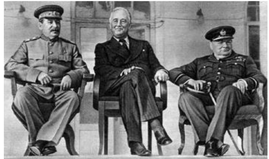
И.В.Сталин, Ф.Рузвельт, У.Черчилль.