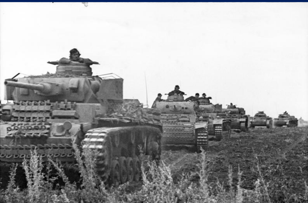
1943 Juni - Juli

Германское наступление началось утром 5 июля 1943 года. Поскольку советскому командованию было точно известно время начала операции — 3 часа ночи (немецкая армия воевала по Берлинскому времени — в переводе на московское 5 часов утра), в 22:30 и в 2:20 по московскому времени силами двух фронтов была проведена контрартподготовка количеством боеприпасов 0.25 боекомплекта. В немецких докладах отмечены значительные повреждения линий связи и незначительные потери в живой силе. Также был произведен неудачный авиационный налет силами 2-й и 17-й воздушных армий (более 400 штурмовиков и истребителей) на Харьковский и Белгородский аэроузлы противника.