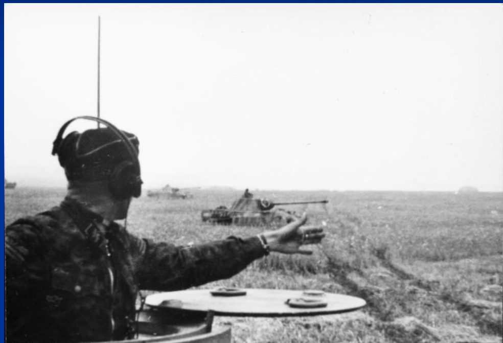
Bundesarchiv, Bild 10111-Merz-023-22 Foto: Merz | 1943 Juli - August

■ Важным фактором успеха немецких танковых частей явился произошедший к лету 1943 г. качественный скачок в боевых характеристиках немецкой бронетехники. Уже в ходе первого дня оборонительной операции на Курской дуге проявилась недостаточная мощность противотанковых средств, находящихся на вооружении советских частей, при борьбе как с новыми немецкими танками Pz.V и Pz.VI, так и с модернизированными танками более старых марок (около половины советских иптап были вооружены 45-мм орудиями, мощность 76-мм советских полевых и американских танковых орудий позволяла эффективно уничтожать современные или модернизированные танки противника на дистанциях вдвое-втрое меньших эффективной дальности огня последних, тяжёлые танковые и самоходные части на тот момент практически отсутствовали не только в общевойсковой 6 гв. А, но и в занимавшей позади неё второй рубеж обороны 1 танковой армии М. Е. Катукова).