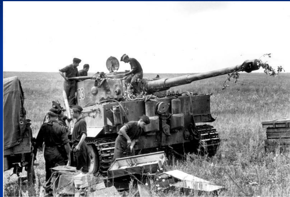
1943 Sommer