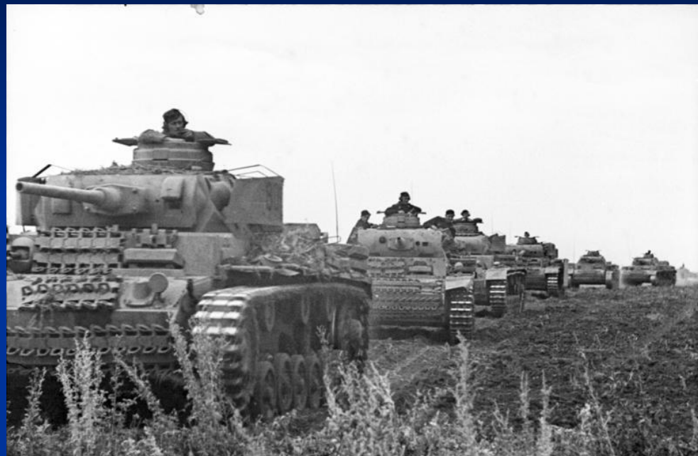
1943 Juni - Juli