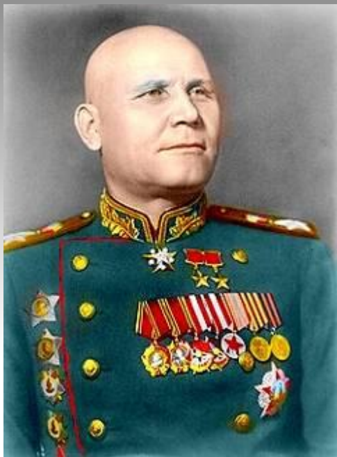
командующий генерал-полковник Иван Конев