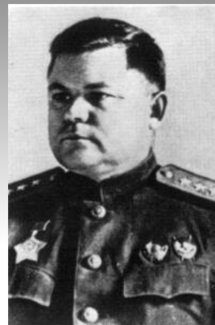
генерал армии Николай Ватутин