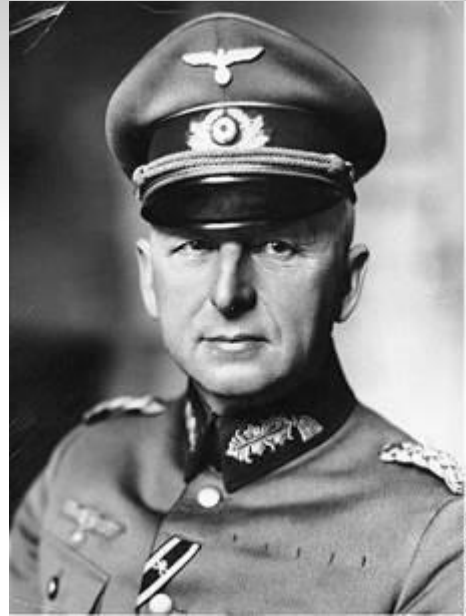
генерал-фельдмаршал Фриц Эрих фон Манштейн (группа армий «Юг»)