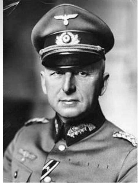
генерал-фельдмаршал Фриц Эрих фон Маништейн (группа армий «Юг»)