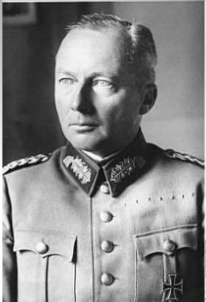
генерал-фельдмаршал Гюнтер Ханс фон Клюге (группа армий «Центр»)