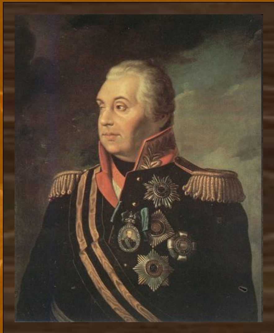
КУТУЗОВ (Голенищев-Кутузов) Михаил Илларионович, светлейший князь Смоленский, русский полководец, генерал-фельдмаршал и дипломат.