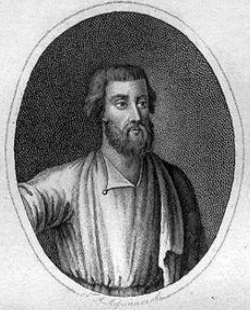
Кузьма Мининъ, Грибоданитъ Нижегородскій, потомъ Думный Дворянинъ.

Деяния Минина не были забыты царём. Минин стал думным дворянином. Государь пожаловал ему во владение большую вотчину – село Богородское в Нижегородском уезде. Вплоть до самой смерти Минин пользовался большим доверием Михаила.