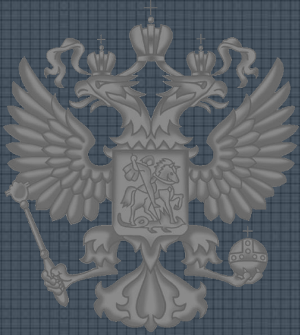
Горельеф с памятника Минину и Пожарскому.