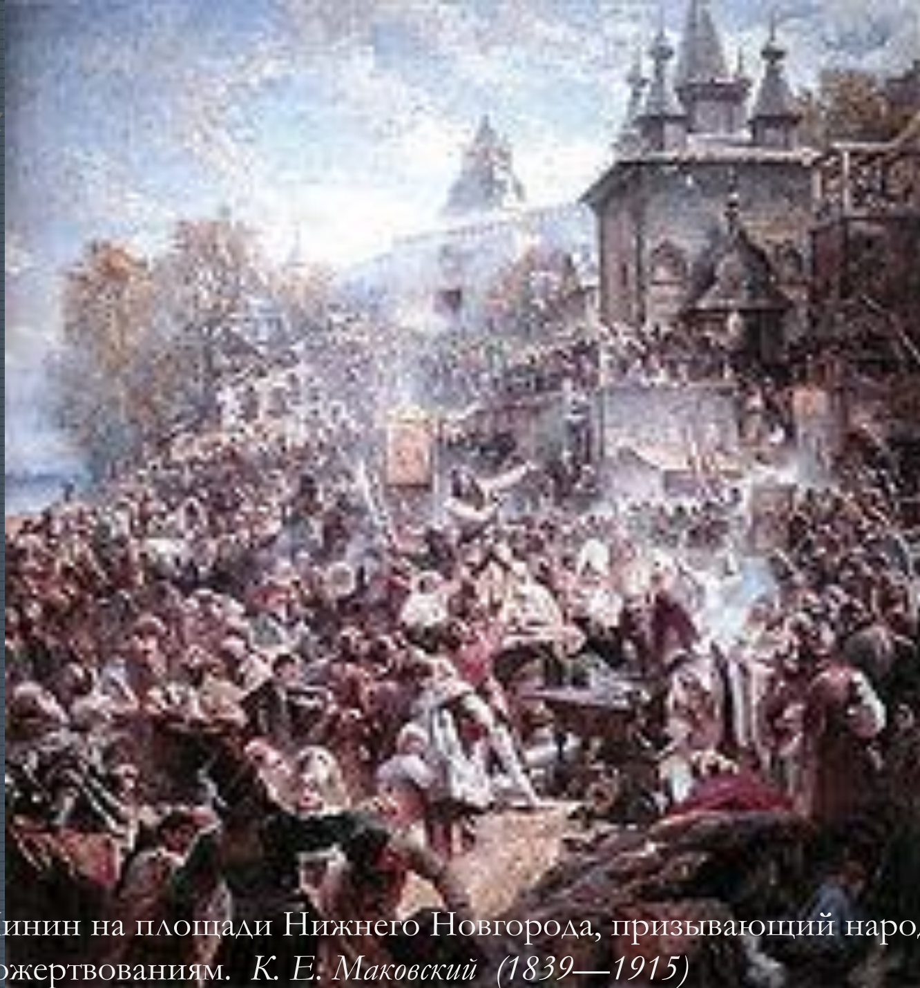
Минин на площади Нижнего Новгорода, призывающий народ к пожертвованиям. К. Е. Маковский (1839—1915)