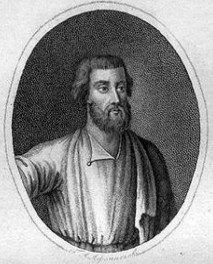
Кузьма Мининъ, Грижданинъ Нижегородскій, потомъ Думный Дворянинъ.

Деяния Минина не были забыты царём. Минин стал думным дворянином. Государь пожаловал ему во владение большую вотчину – село Богородское в Нижегородском уезде. Вплоть до самой смерти Минин пользовался большим доверием Михаила.