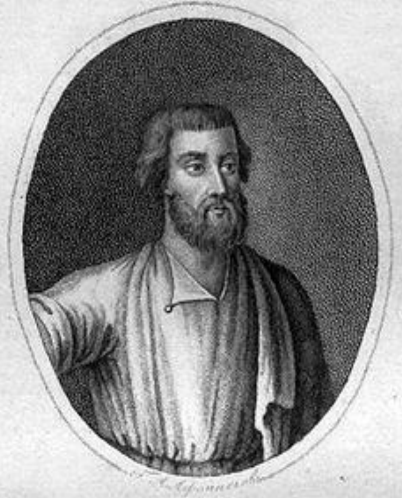
Кузьма Мининъ, Грижданинъ Нижегородскій, потомъ Думный Дворянинъ.

Деяния Минина не были забыты царём. Минин стал думным дворянином. Государь пожаловал ему во владение большую вотчину – село Богородское в Нижегородском уезде. Вплоть до самой смерти Минин пользовался большим доверием Михаила.