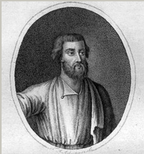
Козьма Мининъ, Гражданинъ Нижегородскій, потомъ Думный Дворянинъ.

Кузьма́ (Козьма́) Ми́нин (полное имя Кузьма́ Ми́нич Заха́рьев Сухору́кий ; конец XVI века — 21 мая 1616 ) — русский национальный герой, организатор и один из руководителей Земского ополчения 1611—1612 в период борьбы русского народа против польской и шведской интервенции.