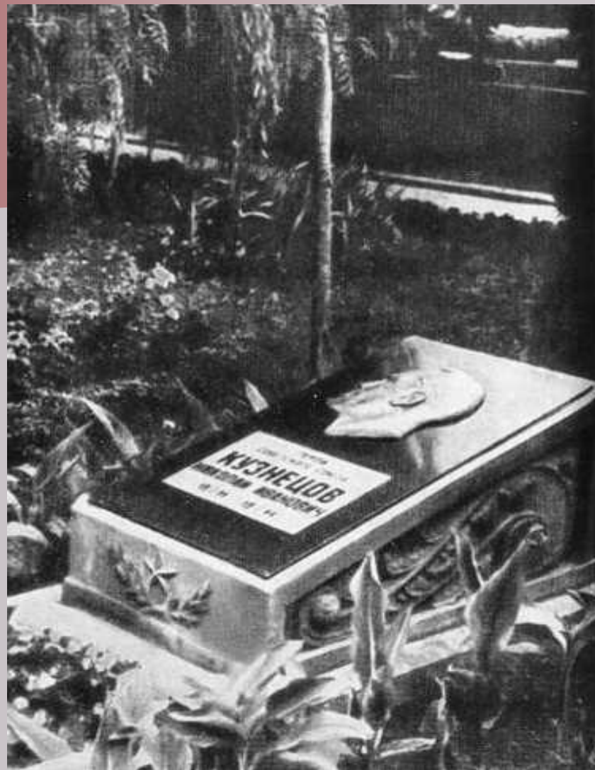
У могилы Н.И. Кузнецова в г. Львове на Холме Славы