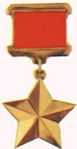
Медаль «Золотая Звезда»