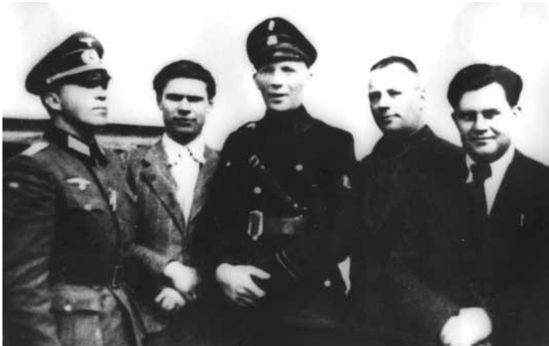
Николай Кузнецов (слева) с офицерами СС. 1942 г.