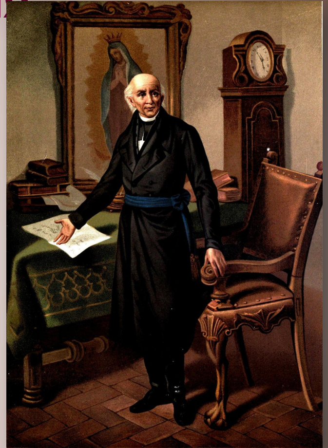
Мигель Идальго Мексика