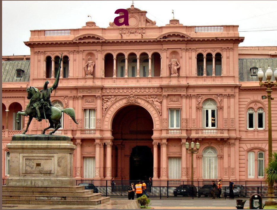
Президентский дворец Каса-Росада (Розовый дом) в Буэнос-Айресе