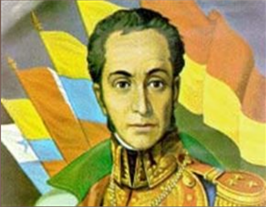
Симон Боливар Венесуэла