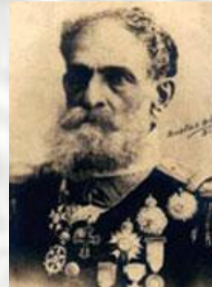
Деодоро да Фонсека

Смена общественно-политического строя в стране произошла практически бескровно, если не считать простреленной ноги военноморского министра, барона де Ладарио, который в самом начале путча попытался "жестко" поговорить с заговорщиками.