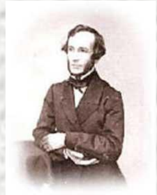
Хуан Баутиста Альберди, собственной персоной