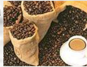
Бразилия являлась поставщиком кофе...