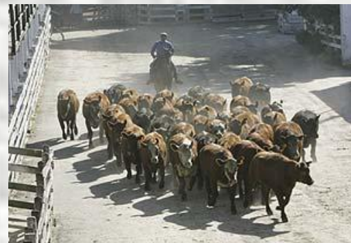
Аргентина – мяса...