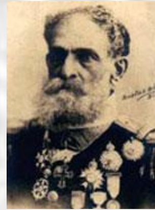
Деодоро да Фонсека

Смена общественно-политического строя в стране произошла практически бескровно, если не считать простреленной ноги военноморского министра, барона де Ладарио, который в самом начале путча попытался "жестко" поговорить с заговорщиками.