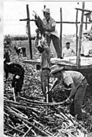
Куба – сахара...