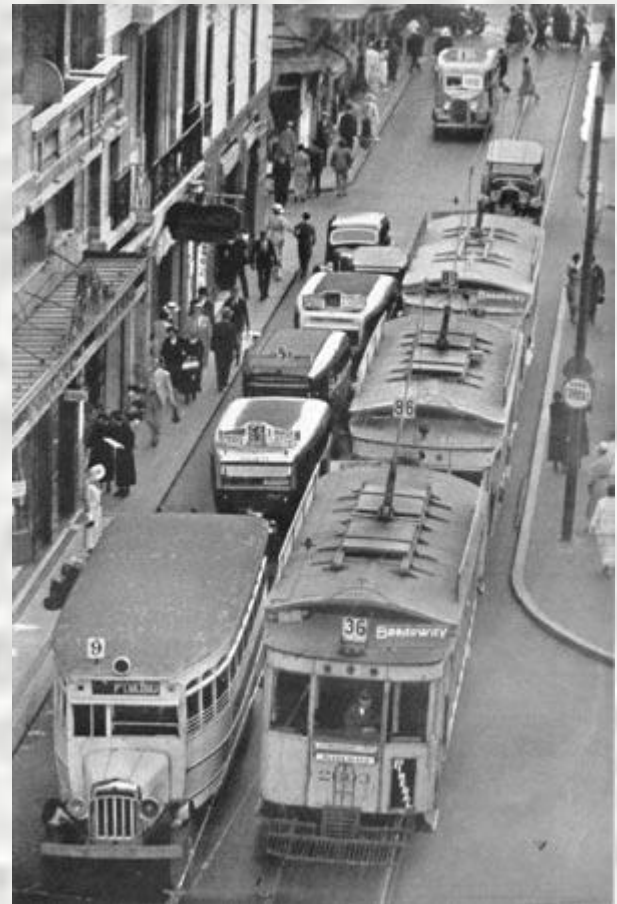
Улица Сармьенте в Буэнос-Айресе