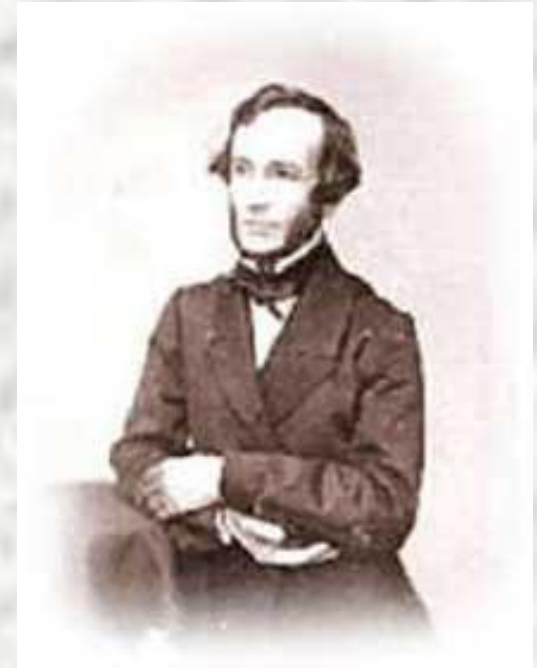
Хуан Баутиста Альберди, собственной персоной