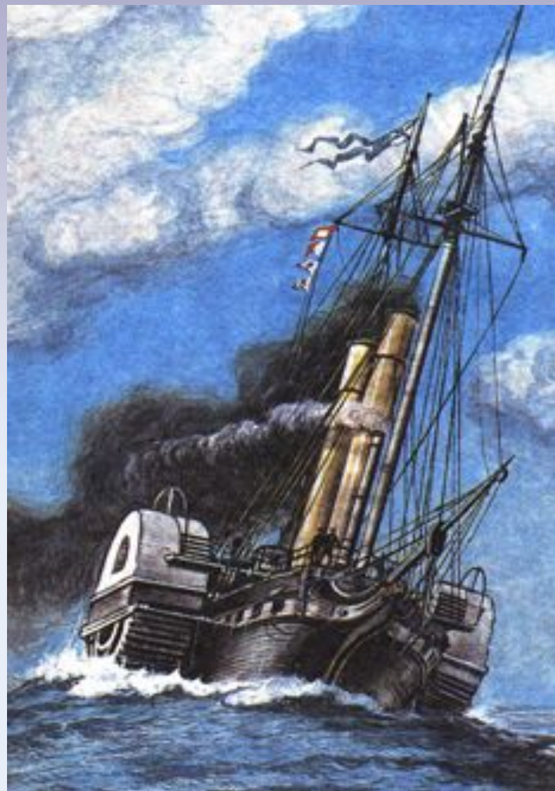
Колесный парово-фрегат "Тамань" 1849 г.

При этом Лазарев добивается заказов на железные паровые суда со всеми новейшими усовершенствованиями, которые позволяла техника того времени. В 1842 г. Лазарев добился заказа на постройку судостроительными верфями для Черноморского флота пяти парово-фрегатом - "Херсонес", "Бессарабия", "Крым", "Гро-моносец", "Одесса". В 1846 г. Лазарев командировал на английские верфи для непосредственного руководства постройкой четырех пароходов для Черноморского флота ("Владимир", "Эльбрус", "Еникале", "Тамань")