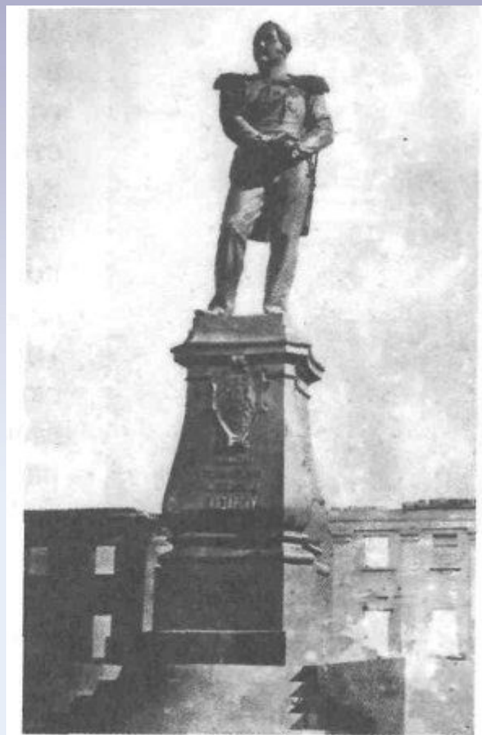
Памятник адмиралу М.П. Лазареву. Вторая половина XIX в.

В 1867 в Севастополе на территории Лазаревских казарм был установлен памятник Михаилу Лазареву. Памятник спроектировал известный русский скульптор Н. С. Пименов. Но он успел выполнить лишь модель монумента и, приехав в Севастополь в 1863 году, выбрать место для его сооружения. После его смерти (1864 г.) отливку фигуры адмирала и установку памятника завершил ученик Пименова - И.И. Подозеров. В 1867 году монумент открыли перед главным корпусом казарм. Памятник представлял собой бронзовую фигуру адмирала во весь рост без головного убора, обращенную лицом к рейду, со зрительной трубой в руке. На гранитном профилированном пьедестале имелась надпись: «Адмиралу генерал-адъютанту Михаилу Петровичу Лазареву. Лета 1866» и бронзовый герб адмирала. Общая высота памятника около 15 м, бронзовой