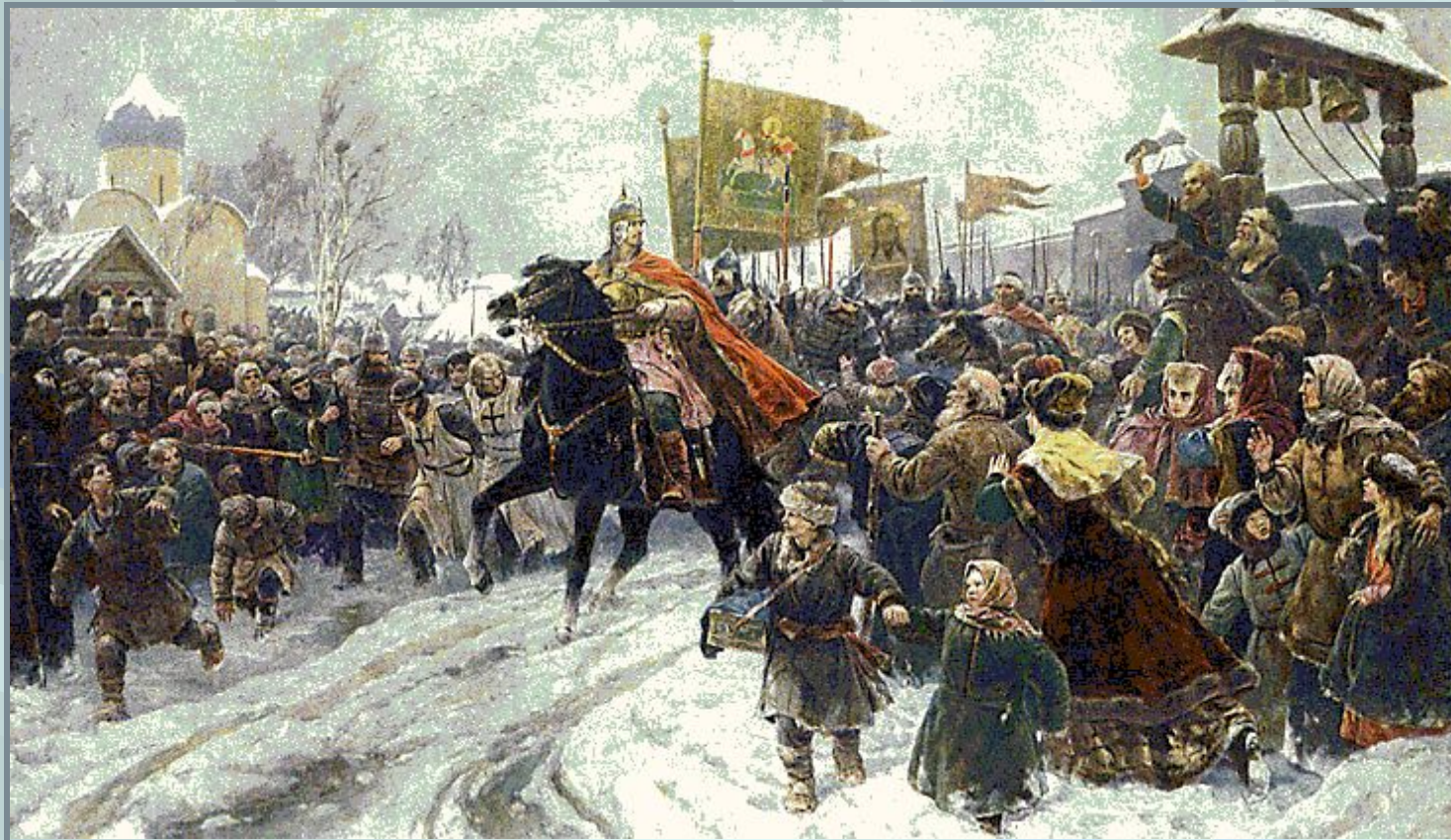
В. А. Серов. «Въезд Александра Невского во Псков»

Весной 1242 г. войско Ливонского рыцарского ордена попыталось вторгнуться в пределы русских земель. Русские дружины во главе с князем Александром Невским встретили агрессора на льду Чудского озера. Здесь 5 апреля 1242 г. произошло сражение, которое вошло в историю, под названием Ледового побоища.