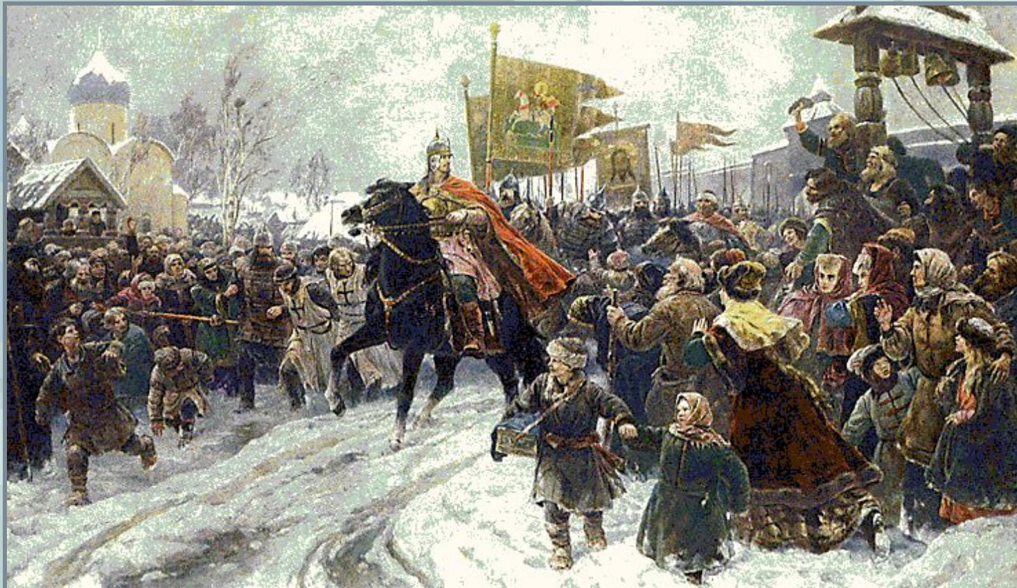
В. А. Серов. «Въезд Александра Невского во Псков»

Весной 1242 г. войско Ливонского рыцарского ордена попыталось вторгнуться в пределы русских земель. Русские дружины во главе с князем Александром Невским встретили агрессора на льду Чудского озера. Здесь 5 апреля 1242 г. произошло сражение, которое вошло в историю, под названием Ледового побоища.