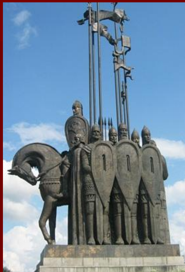
Памятник в Пскове