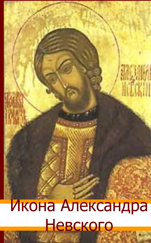
Икона Александра Невского