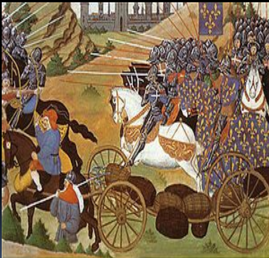
La bataille des "harengs" à Rouvray le 12 février 1429