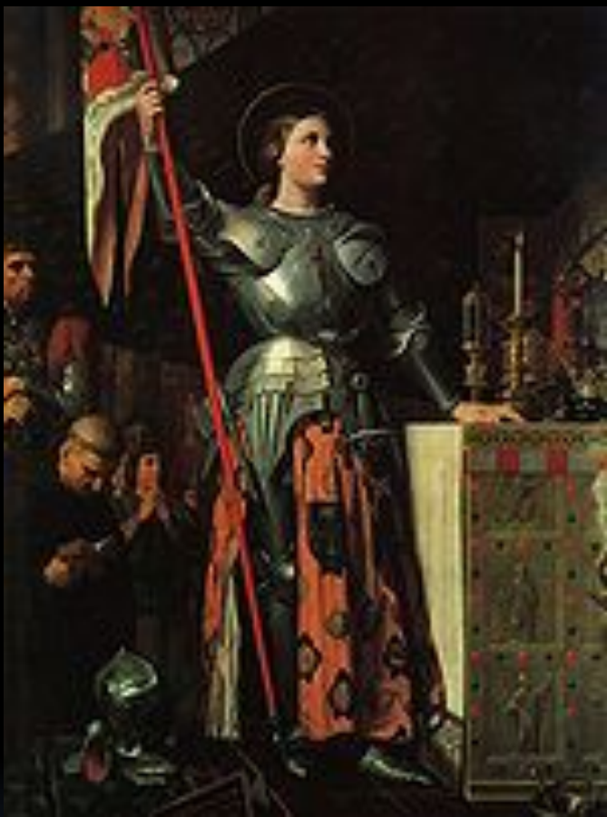
Жанна д'Арк на коронации Карла VII. Жан Огюст Доминик Энгр, 1854

Город за городом открывал ворота перед королевской армией, 17 июля король был торжественно миропомазан в Реймском соборе в присутствии Жанны д'Арк, что вызвало необычайный всплеск национального духа в стране.