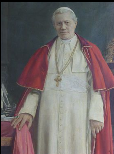
Святой Пий X