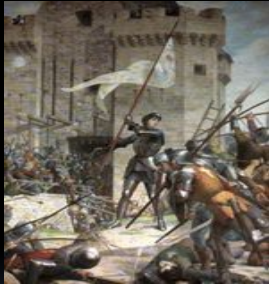
Жанна д'Арк при осаде Орлеана.

После того, как не было найдено ничего, что могло бы бросить тень на репутацию девушки, Карл решился передать в её руки командование войсками и назначил её главнокомандующим