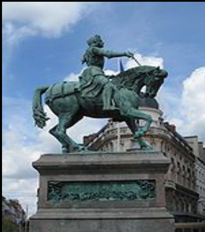
Памятник Орлеанской деде (1855) на центральной площади Орлеана