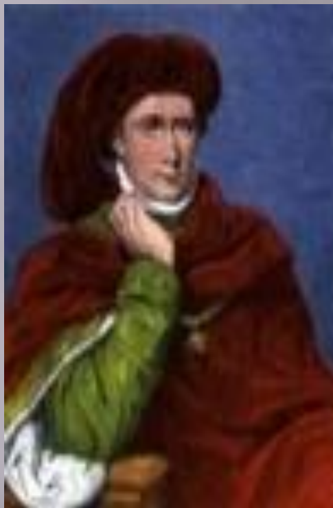
Карл VI, Безумный