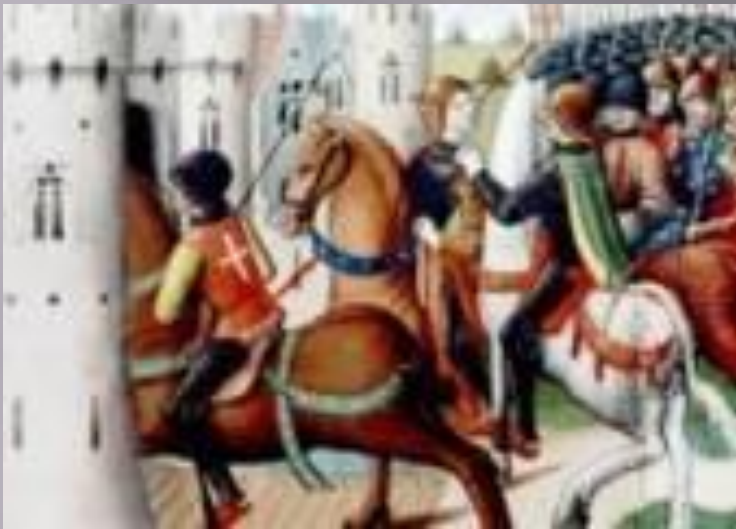
«Взятие Жанны д'Арк в плен.» Миниатюра из рукописи XV века.