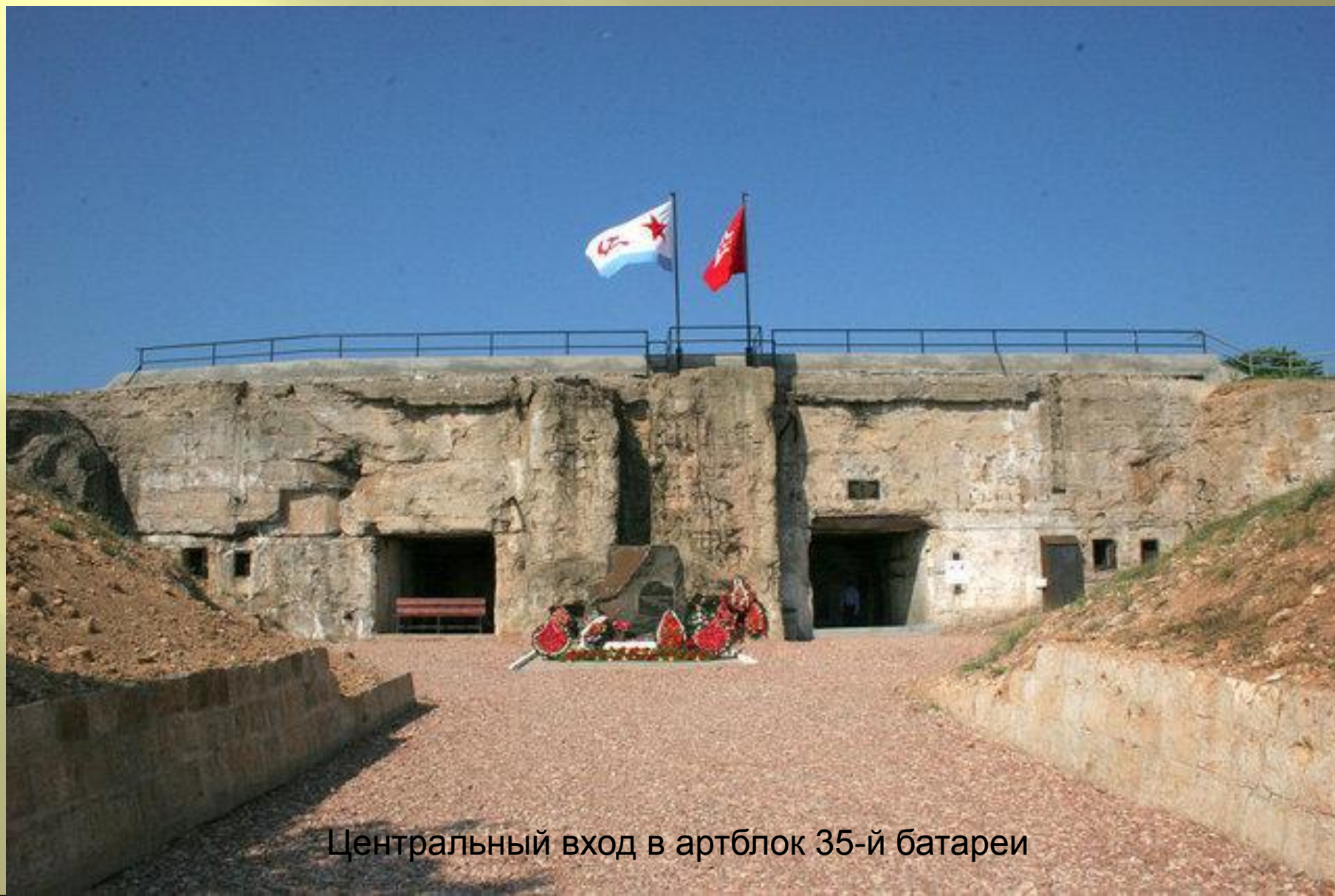
Центральный вход в артблок 35-й батареи

Сильно разрушенную 35-ю батарею восстанавливать не стали. С 2007 года на территории 35 береговой батареи находится музейный историко-мемориальный комплекс «35-я береговая батарея».