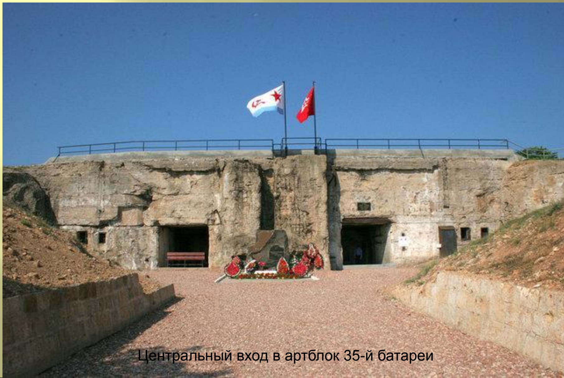
Центральный вход в артблок 35-й батареи

Сильно разрушенную 35-ю батарею восстанавливать не стали. С 2007 года на территории 35 береговой батареи находится музейный историко-мемориальный комплекс «35-я береговая батарея».