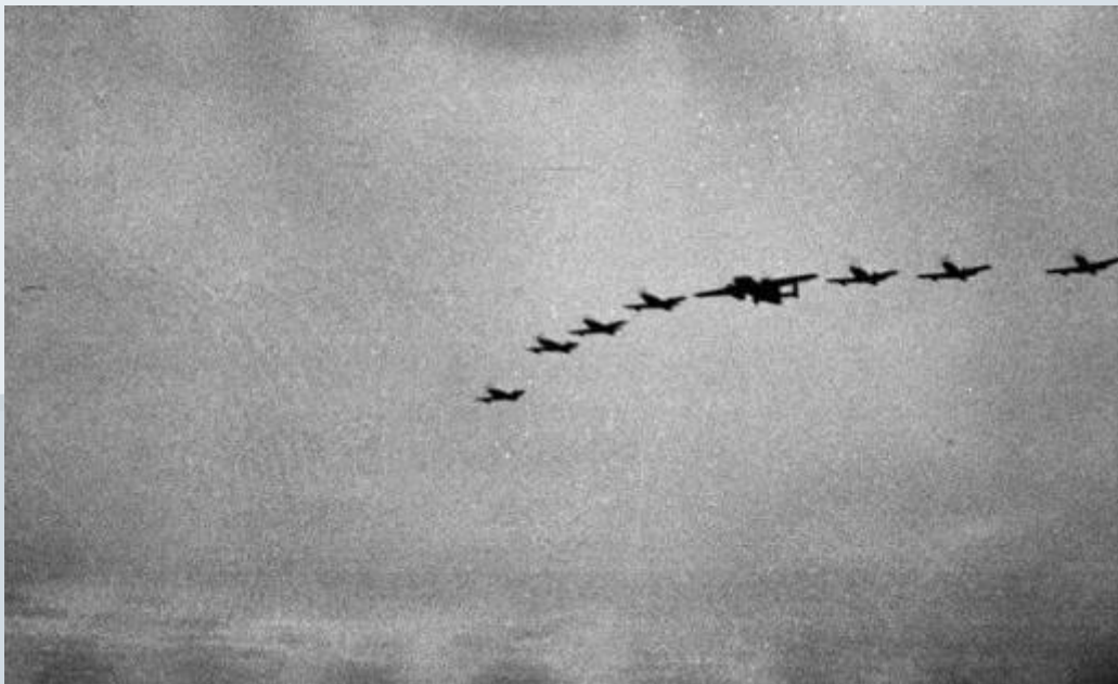
Американские самолеты перегонаются по трассе «Алсиб»