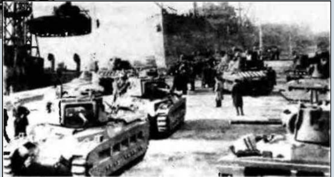
Погрузка британских танков «Матильда» и «Валентайн».