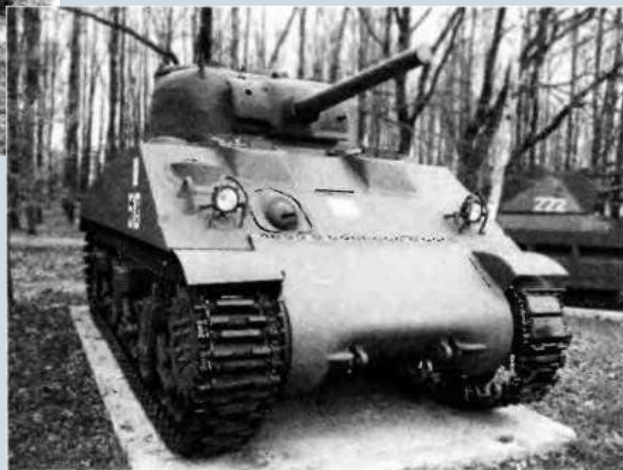
Средний танк М4А2 в Музее Великой Отечественной войны в Москве.