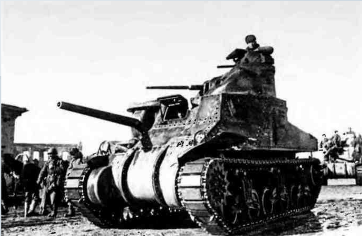
МЗс на улице освобождённой Вязьмы. Западный фронт, 1943 года.