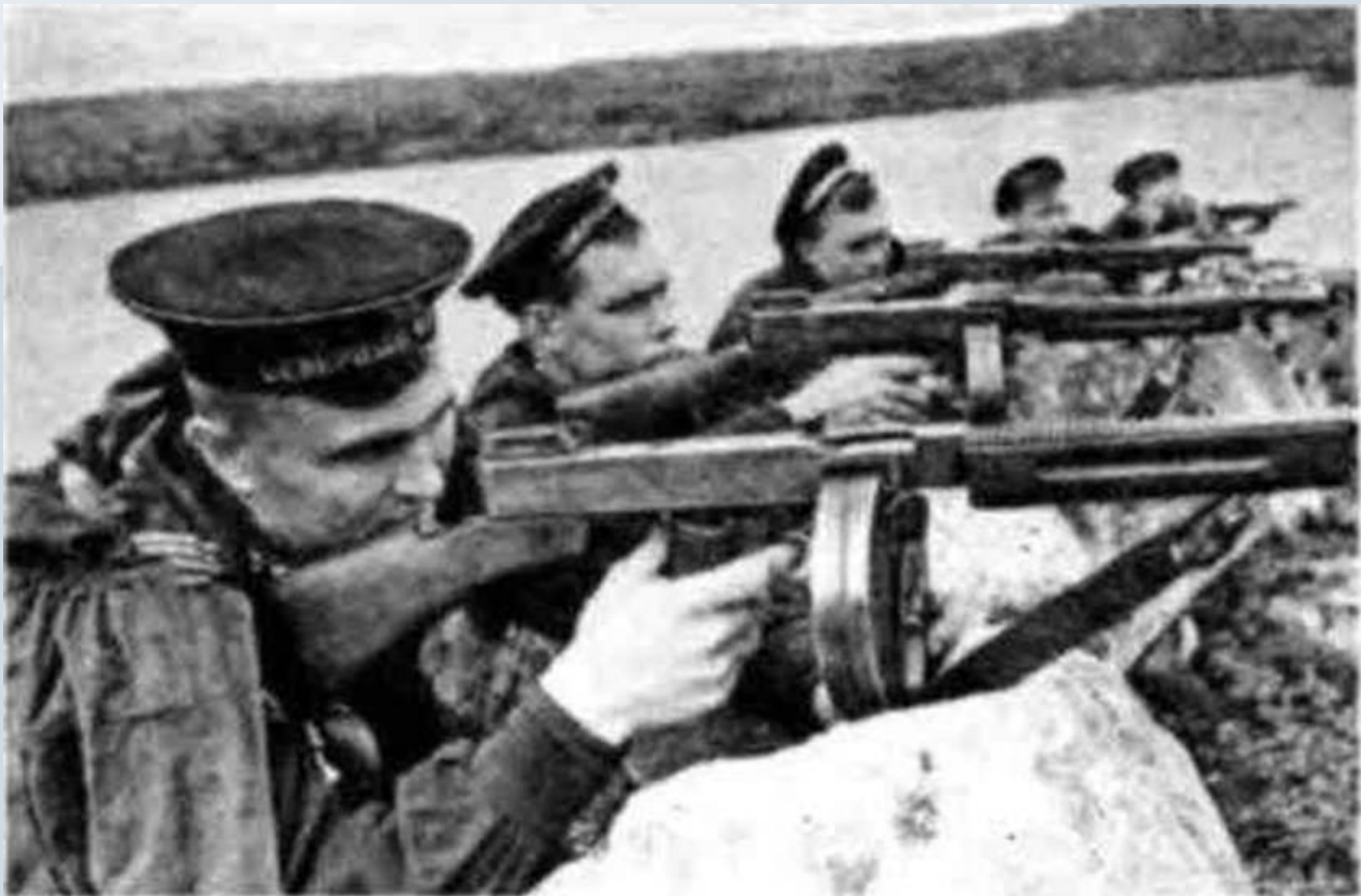
Моряки-североморцы, вооруженные пистолетами-пулеметами «Томпсон». 1943 год