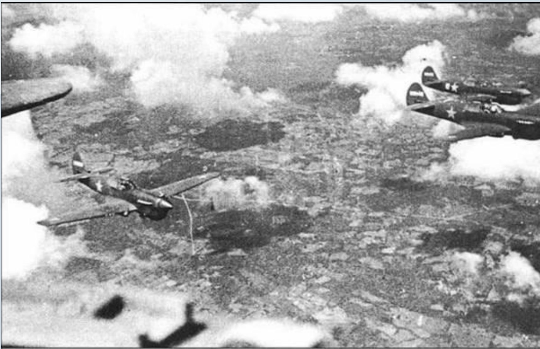
Истребители «Киттихоук» над освобожденным Крымом