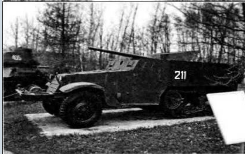
Самоходная артиллерийская установка Т48 (в Красной Армии – СУ-57)