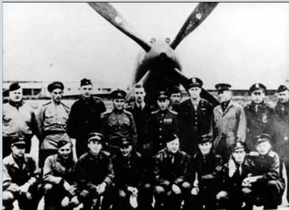
Советские и американские летчики перегонявшие самолеты по «Алсибу»