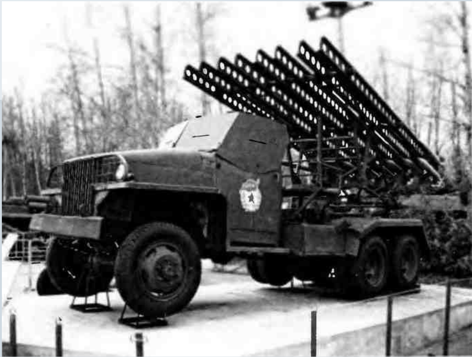
Реактивная установка БМ-13 на шасси автомобиля «Студебеккер»