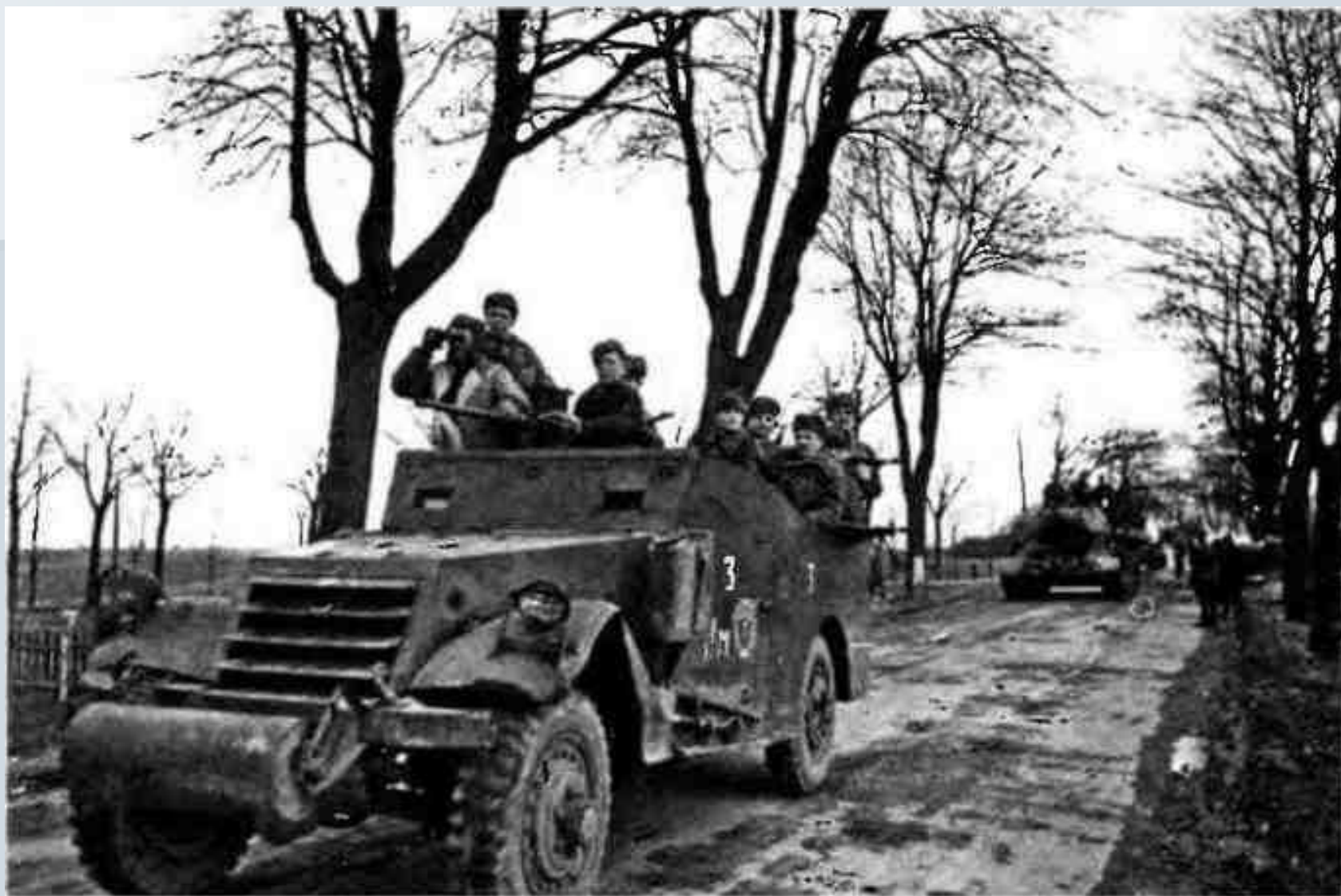
Разведчики на БТР МЗА1. 3-й гвардейский танковый корпус, 2-й Белорусский фронт