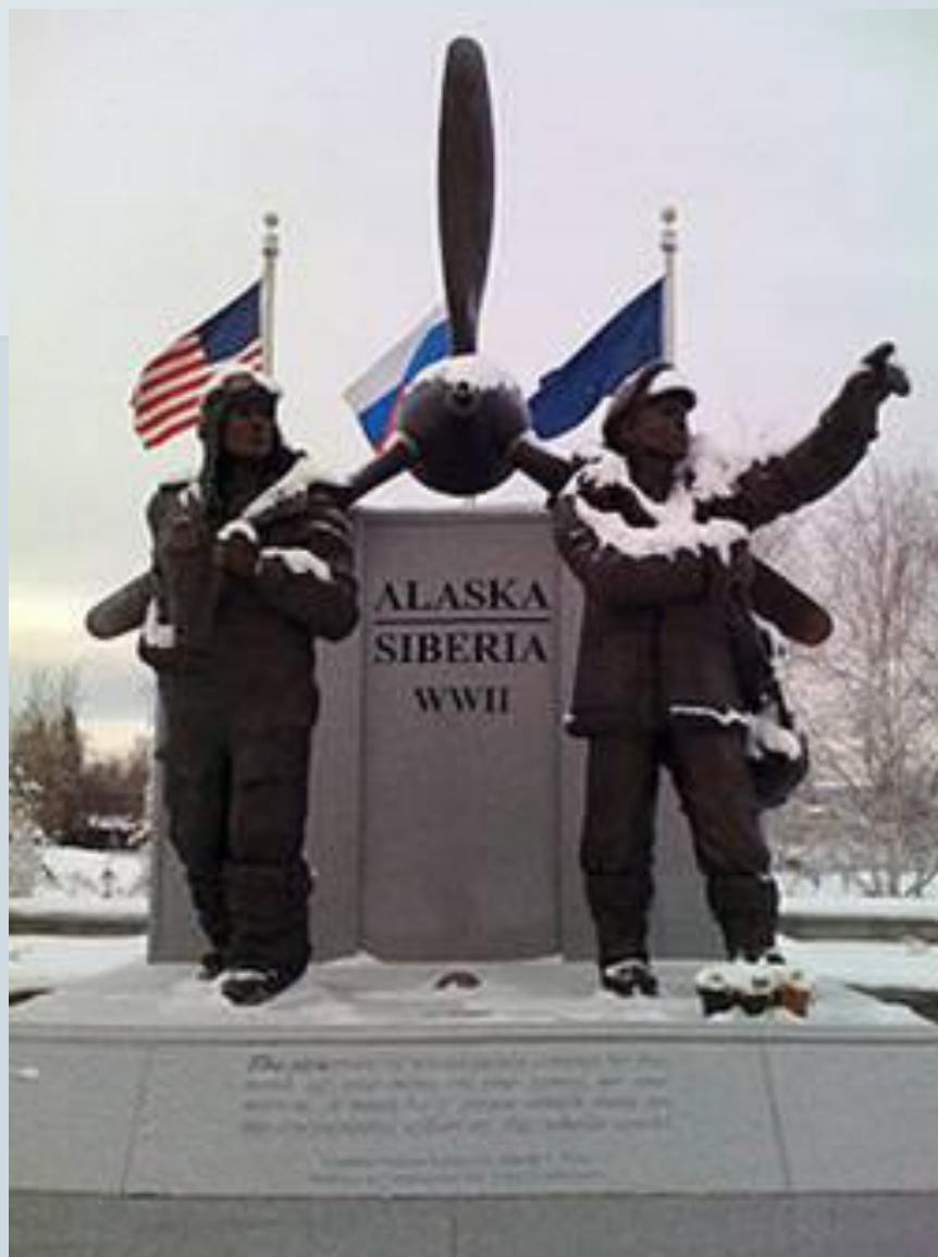
Памятный монумент в Фэрбенксе