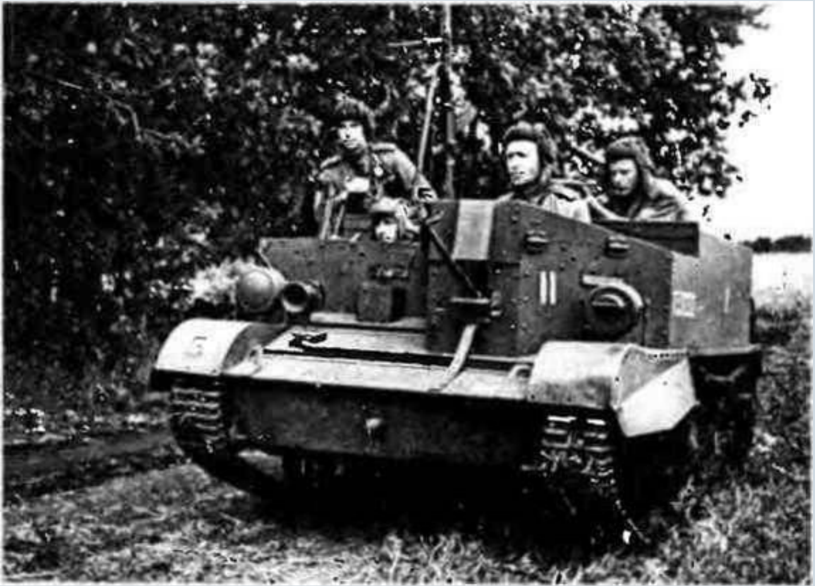
Разведчики на бронетранспортёре «Универсал». Орловско-Курская дуга, июль 1943 года