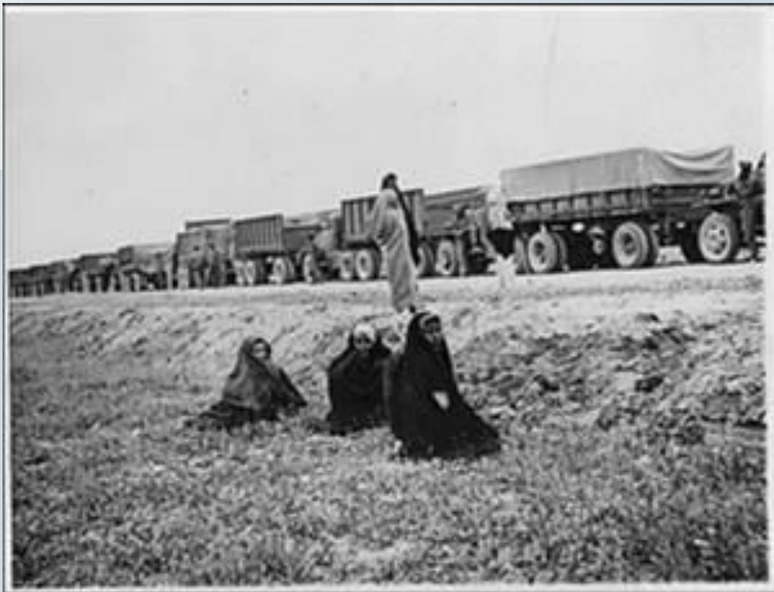
Студебеккеры в Иране по пути в СССР