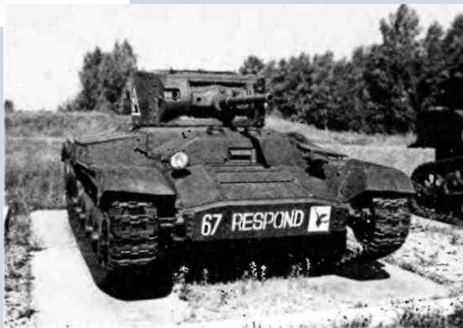
Пехотный танк «Валентайн»