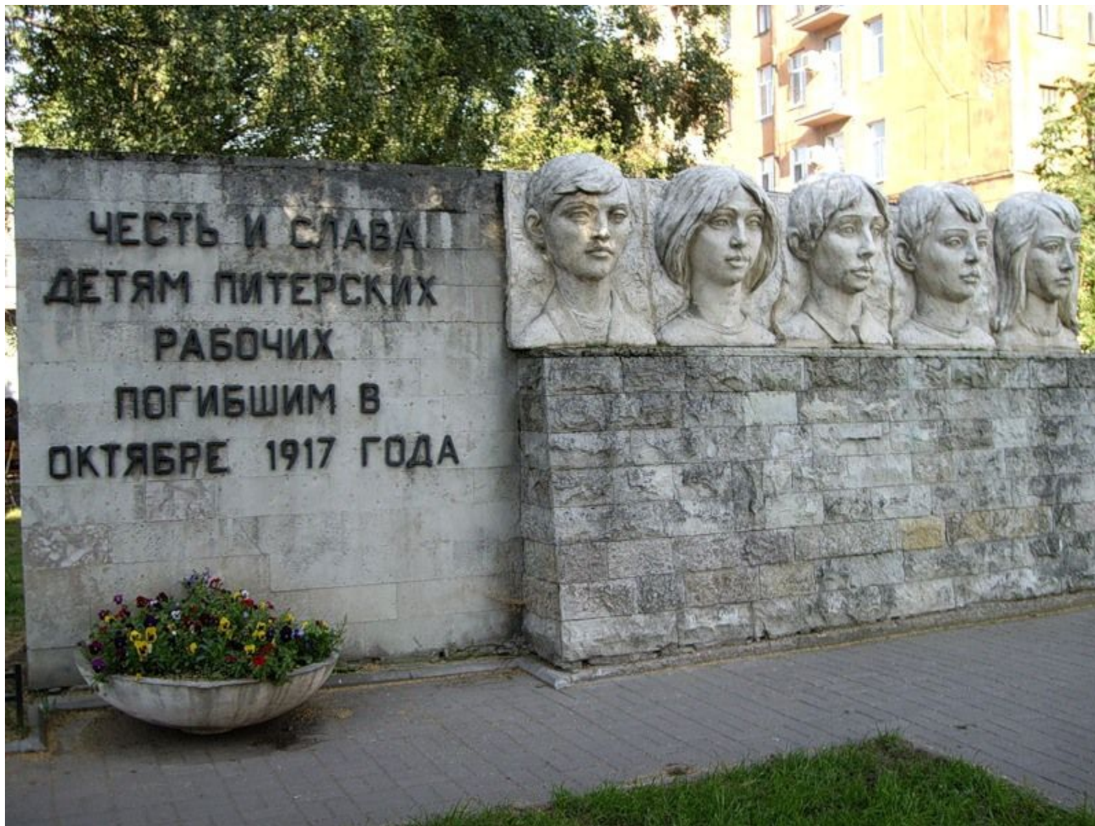
был открыт 17 мая 1972 года, к 50-летию пионерской организации