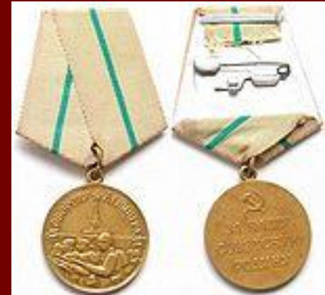
Медаль «За оборону Ленинграда»