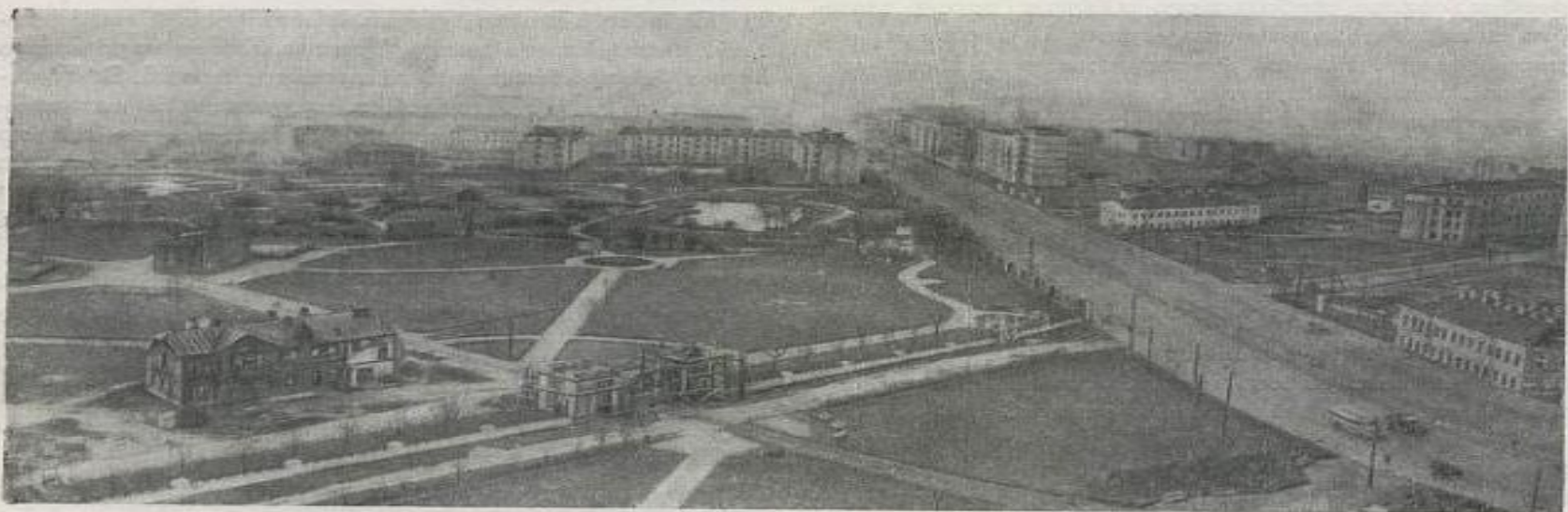
Реконструкция сада 9 Января, проведенная в 1945—1947 гг. Авторы проекта — архитекторы В. А. Каменский и А. В. Модзалевский.