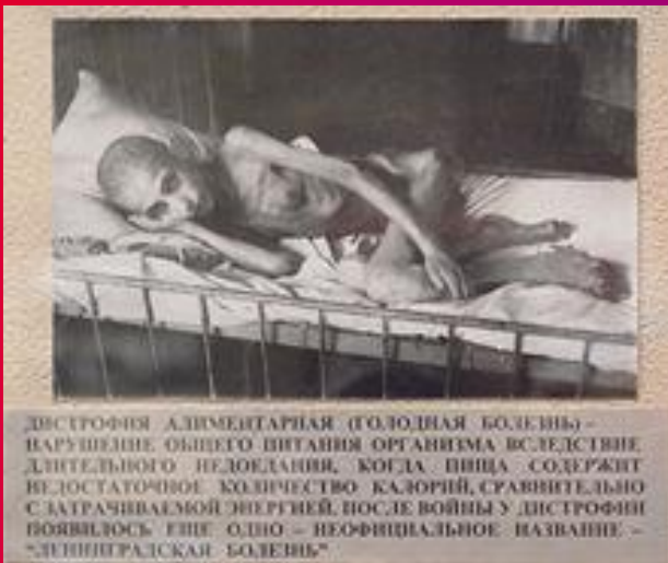
ДИСТРОФИЯ АЛЪМЕНТАРНАЯ (ГОЛОДНАЯ БОЛЕЗНЬ) – НАРУШЕНИЕ ОБЩЕГО ПИТАНИЯ ОРГАНИЗМА ВСЛЕДСТВИЕ ДЛИТЕЛЬНОГО НЕДОЕДАНИЯ, КОГДА ПИЩА СОДЕРЖИТ НЕДОСТАТОЧНОЕ КОЛИЧЕСТВО КАЛОРИЙ, СРАВНИТЕЛЬНО С ЗАТРАЧИВАЕМОЙ ЭНЕРГИЕЙ. ПОСЛЕ ВОЙНЫ У ДИСТРОФИИ ВОЯВИЛОСЬ ЕЩЕ ОДНО – НЕОФИЦИАЛЬНОЕ НАЗВАНИЕ – “ЛЕНИНГРАДСКАЯ БОЛЕЗНЬ”

За годы блокады погибло, по разным данным, от 400 тыс. до 1 млн человек. Так, на Нюрнбергском процессе фигурировало число 632 тысячи человек. Только 3 % из них погибли от бомбёжек и артобстрелов; остальные 97 %