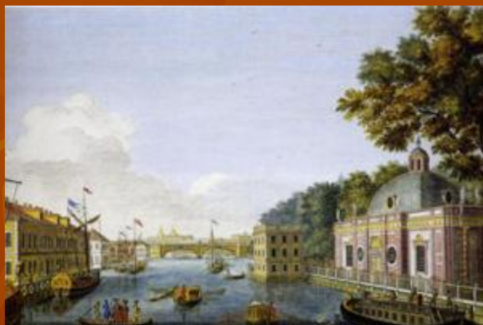
Гравюра М.Махаева, 1753 г. Вид с Фонтанки.