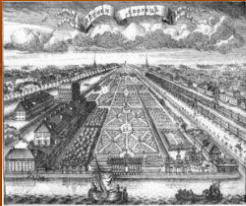
А.Зубов, гравюра «Летний сад и Летний дворец», 1716 г.