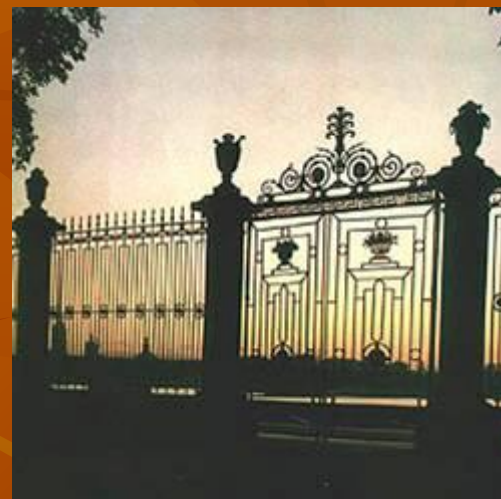
Ограда со стороны Невы