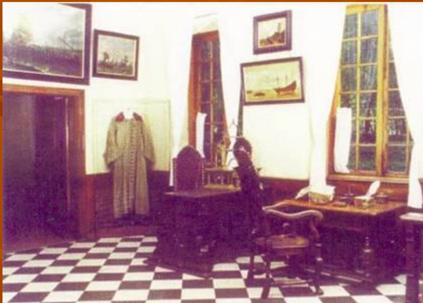
Нартов Андрей Константинович (1693–1756)