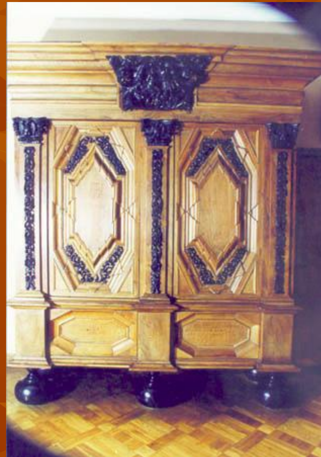
Ореховый шкаф Петра Первого, нач.18 века, Гамбург