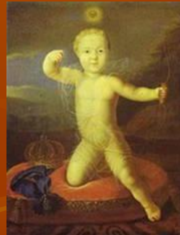
Петр Петрович. Худ. Луи Каравак