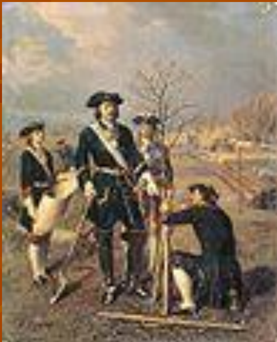
Петр Первый за работой