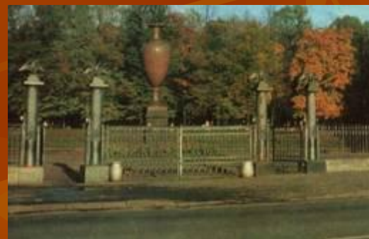
Ограда со стороны Мойки, арх. Шарлемань