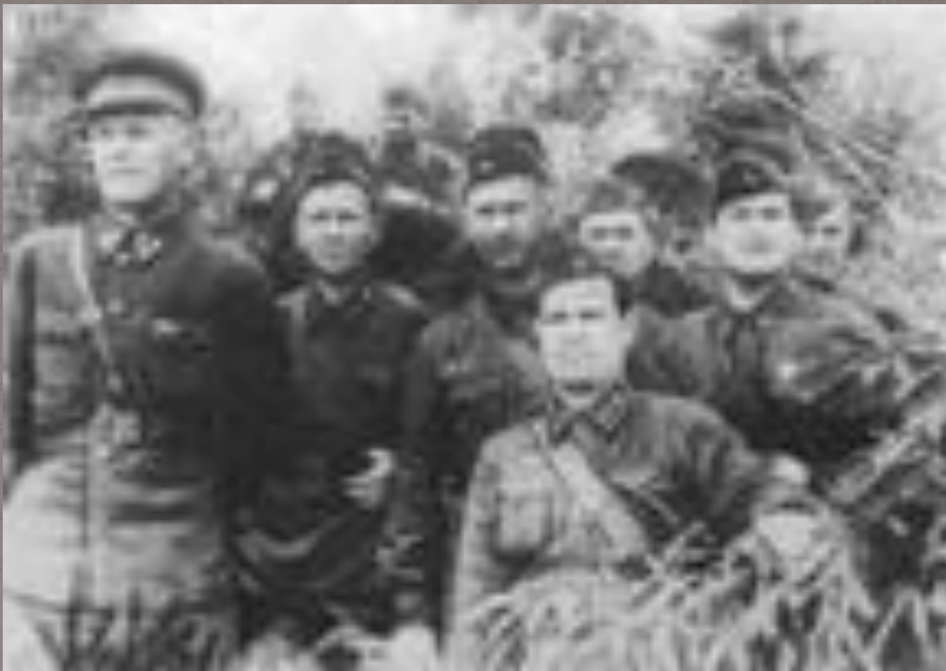
А. Фадеев и М.Шолохов на Западном фронте