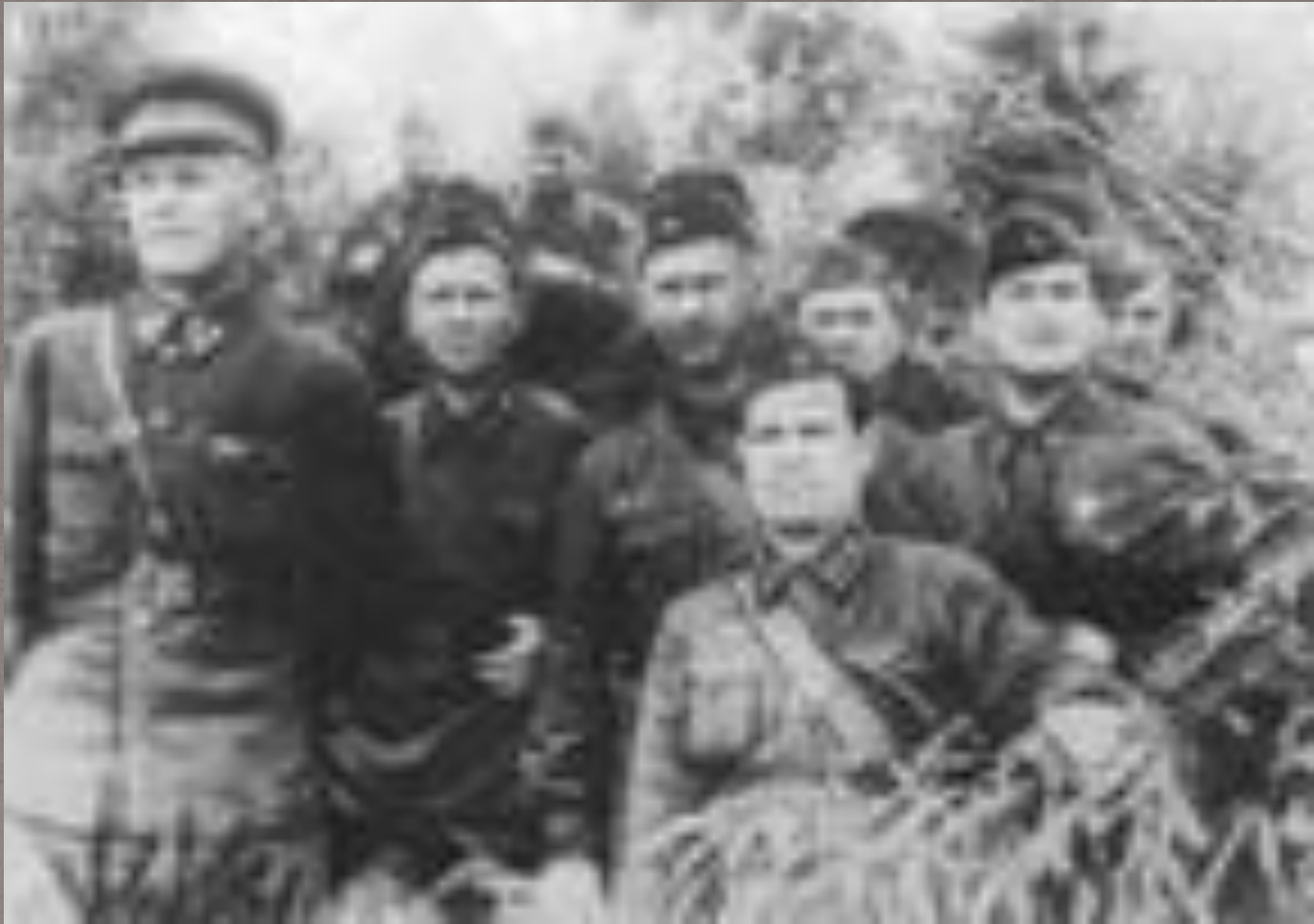
А. Фадеев и М.Шолохов на Западном фронте