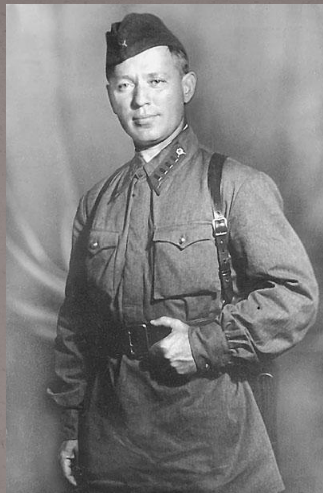
Перед отправкой на фронт

знаменательно входит и в жизнь Шолохова. Судьба воюющего народа становится и его судьбой. Шолохов сражался как писатель, на страницах газет стали появляться его статьи и очерки.