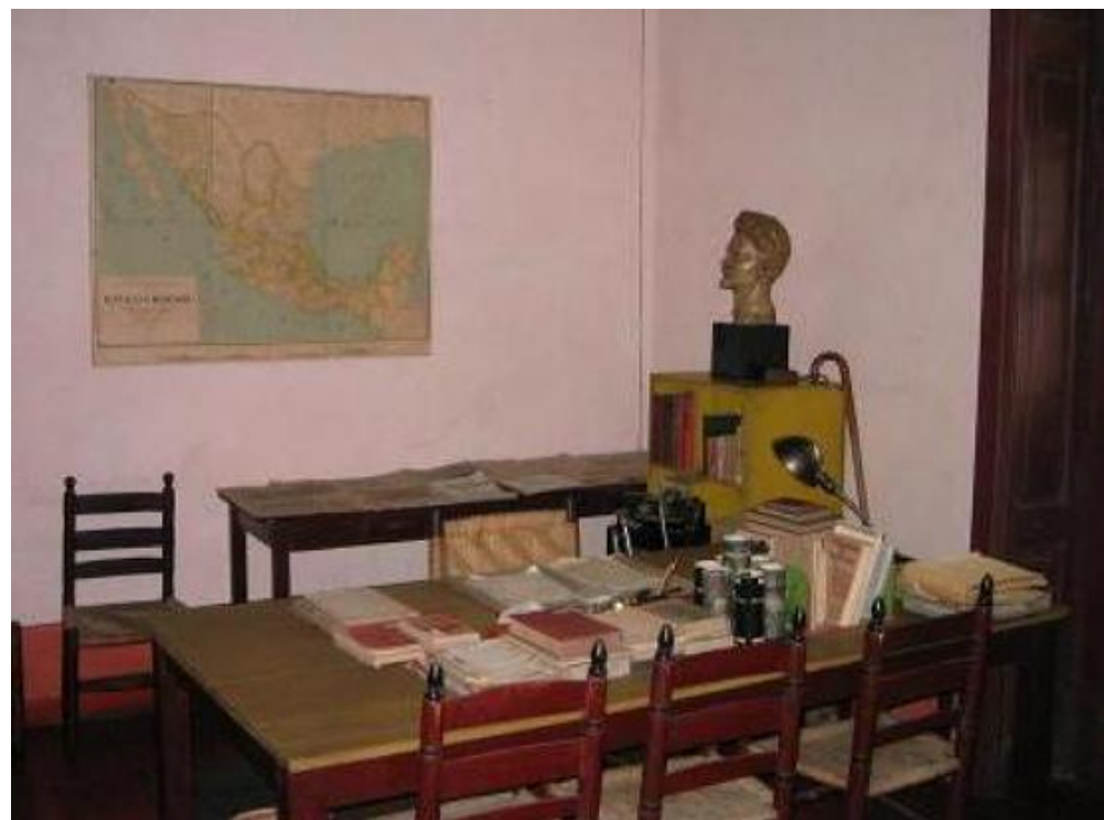
Троцький в творчості