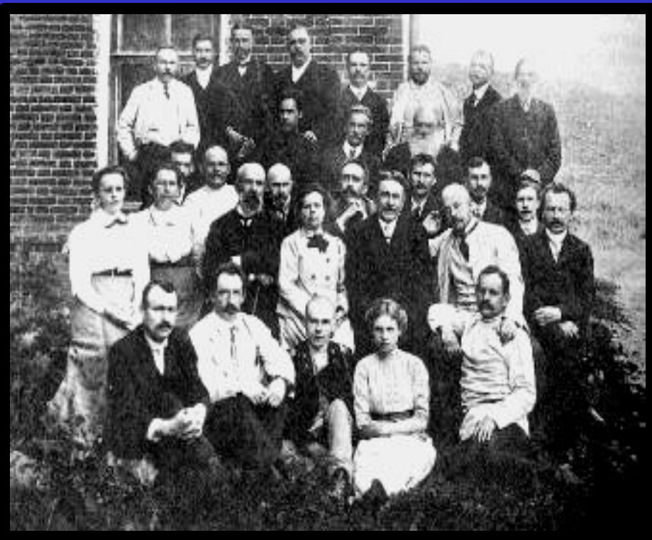
Врачи Земской больницы в Дмитрове.

Непоследовательно выдержан принцип всословности. Выборы строились по сословному признаку. При этом распределение по куриям давало значительные преимущества дворянам. Вокруг земств сгруппировалась наиболее энергичная, демократически настроенная интеллигенция