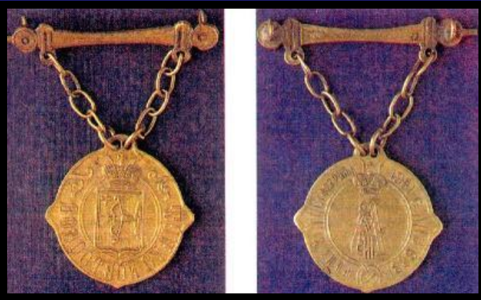
Знак волостного судьи.