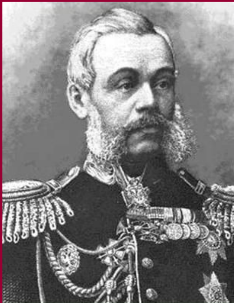
Военный министр Д.А.Милютин

В 1874 г. была проведена военная реформа по инициативе Д.А.Милютин.