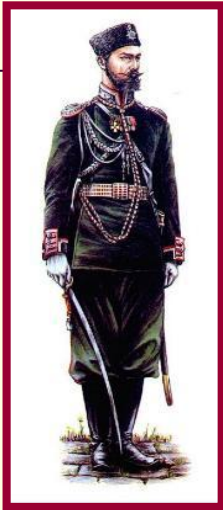
Офицер Генерального штаба.

В армии отменялись телесные наказания, улучшался быт и обучение солдат.