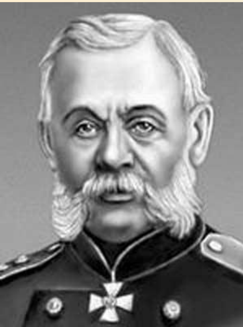
Военный министр Дмитрий Алексеевич Милютин с 1861г.