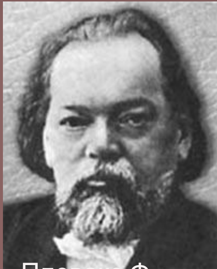
Плевако Ф. Н.