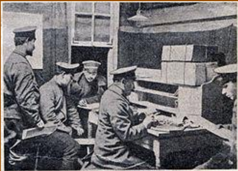
Просмотр корреспонденции с театра войны военной цензурой.

✓ Без цензуры могли выходить только правительственные и научные издания, а также литература, переведенная с иностранного языка.