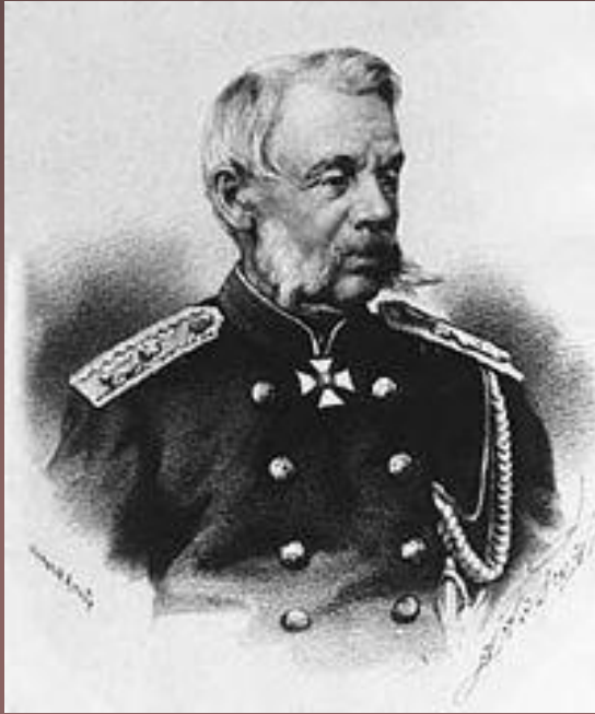
Милютин Д.А., военный министр