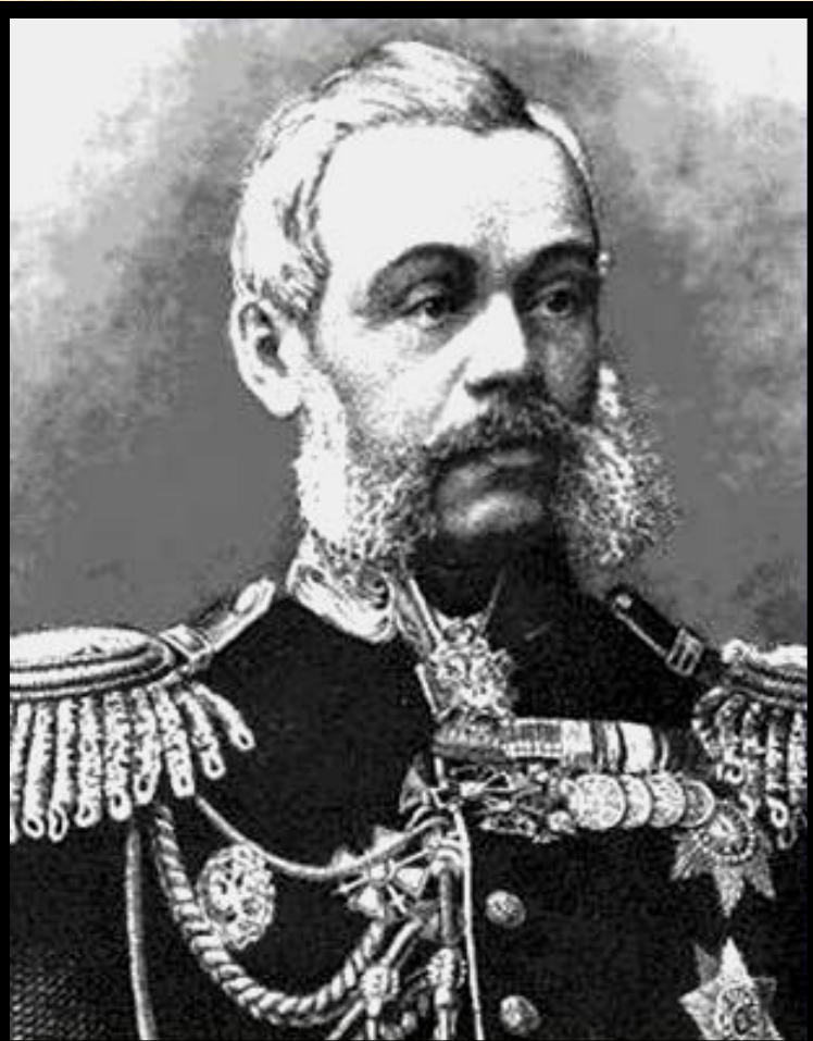
Военный министр Д.А.Милютин

В 1874 г. была проведена военная реформа по инициативе Д.А. Милютина.