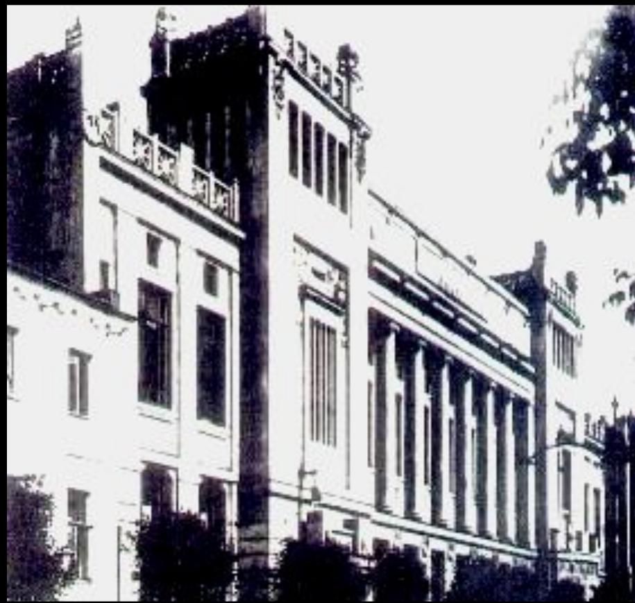
Здание купеческого собрания на Малой Дмитровке.

В 1870 г. была проведена городская реформа, создавшая всесословные городские думы и управы. Избирателями были лица достигшие 25 лет и платившие городские налоги. Они в зависимости от доходов делились на 3 курии, избравшие в городскую думу равное число гласных.