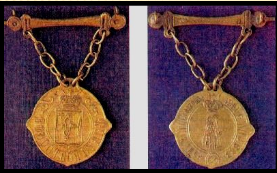
Знак волостного судьи.