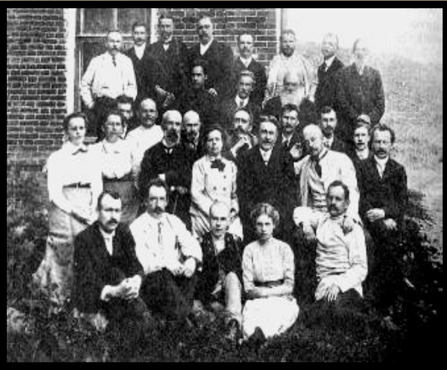
Врачи Земской больницы в Дмитрове.

Непоследовательно выдержан принцип сословности. Выборы строились по сословному признаку. При этом распределение по куриям давало значительные преимущества дворянам. Вокруг земств сгруппировалась наиболее энергичная, демократически настроенная интеллигенция