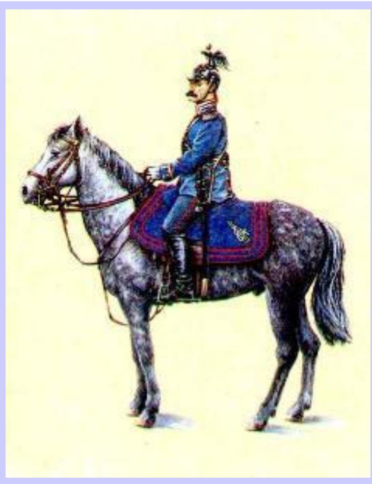
Жандарм в парадной форме

Главной задачей консерваторов стала попытка оградить императора от влияния либералов и стремление ограничить реформы.