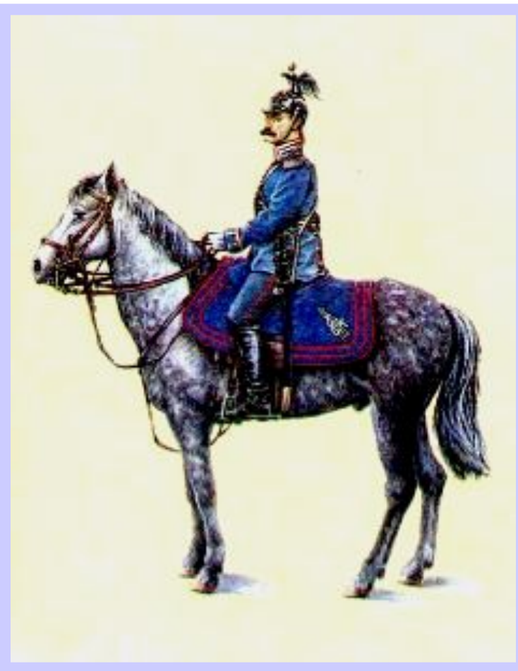
Жандарм в парадной форме

Главной задачей консерваторов стала попытка оградить императора от влияния либералов и стремление ограничить реформы.