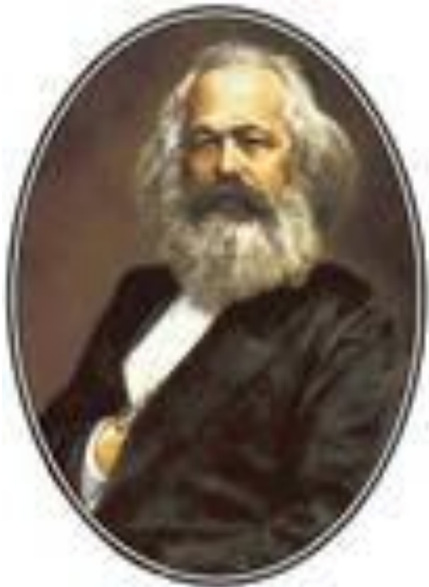
Карл Маркс (1818-1883)