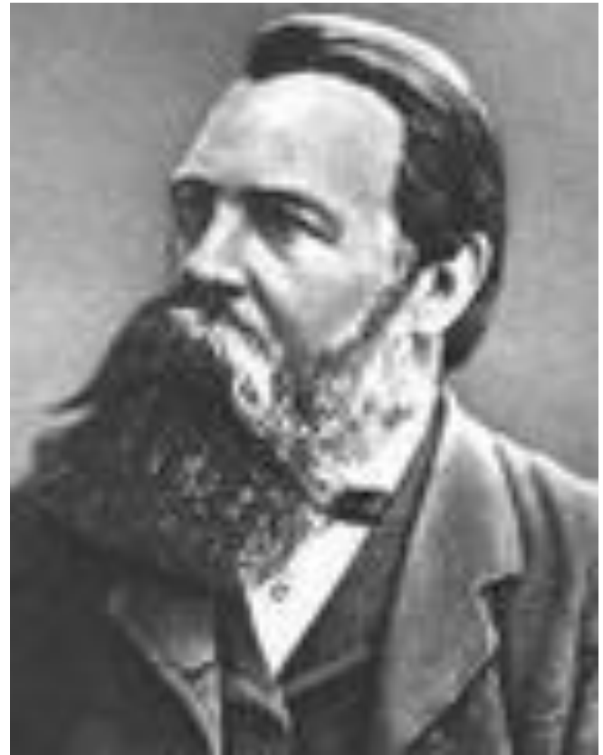
Фридрих Энгельс (1820-1895)