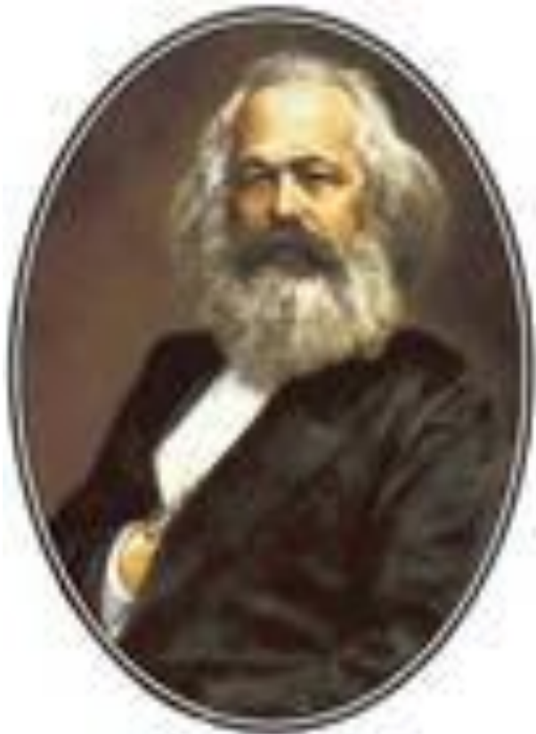
Карл Маркс (1818-1883)