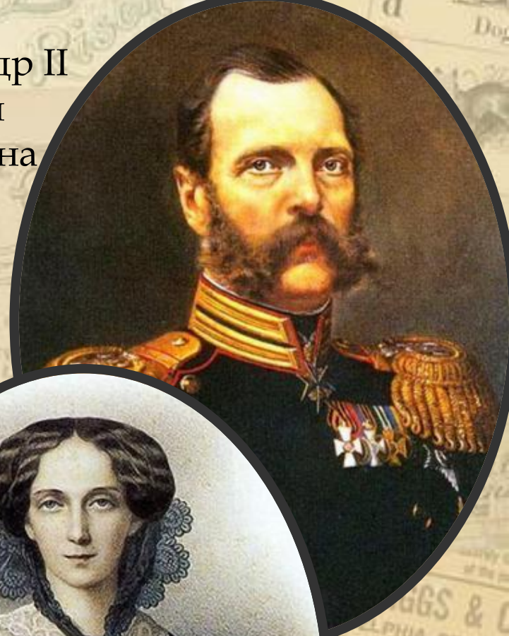
Александр II и Мария Федоровна