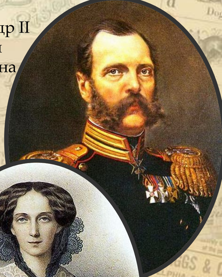
Александр II и Мария Федоровна