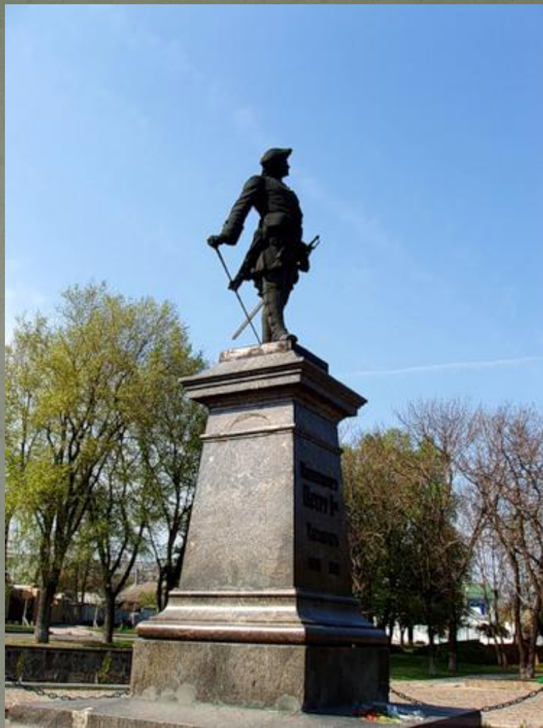
Петр I. Памятник в Петербурге.