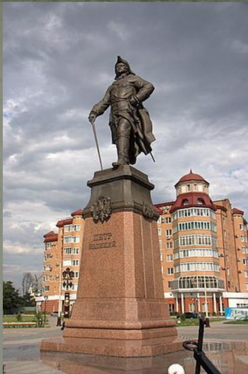
17-я пристань и площадь Петра 1-го