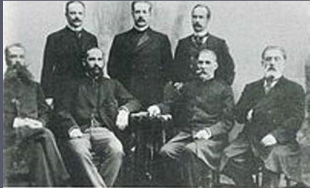
П.А. Столыпин — в Ковно, с уездными предводителями дворянства Ковенской губернии. 1901 год

Столыпин провёл на службе в Ковно около 13 лет — с 1889 по 1902 годы. Это время его жизни было самым спокойным.