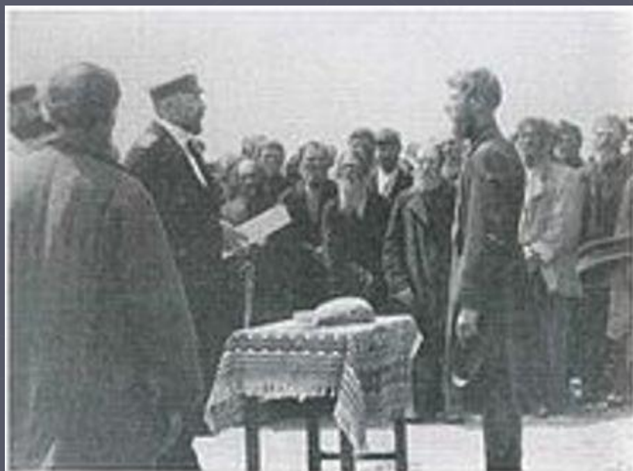
П. А. Столыпин принимает подарок от волостного старшины в селе Пристанном

В Саратове Столыпин всё больше убеждается в необходимости коренных перемен в жизни крестьян. Опыт жизни в Западных губерниях Российской Империи подсказывал ему естественный выход в отходе от отживших способов землевладения. Ещё в 1904 году, характеризуя положение саратовского крестьянства, он пишет Государю: «Жажда земли, аграрные беспорядки сами по себе указывают на те меры, которые могут вывести крестьянское население из настоящего ненормального положения. Единственным противовесом общинному началу является единоличная собственность».