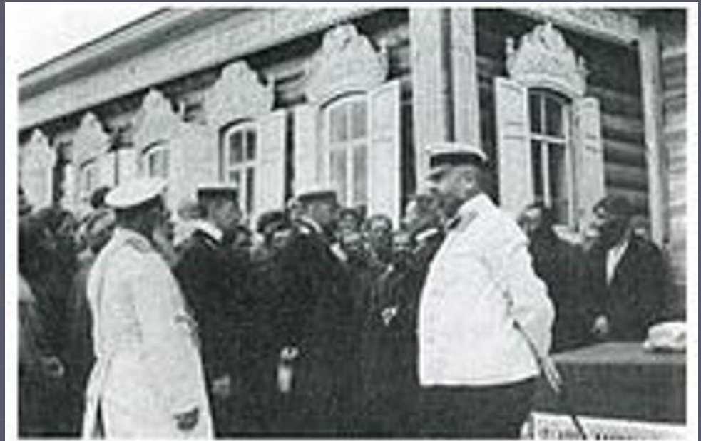
Станция Булгаковка Волыского уезда Саратовской губернии. Июль 1904 года

Назначение Столыпина саратовским губернатором в феврале 1903 года являлось повышением по службе и свидетельствовало о признании его заслуг на различных должностях в Ковно и Гродно. После поражения в войне с Японией страну захлестнули революционные события. При наведении порядка Столыпин проявлял редкое мужество и бесстрашие. Благодаря его энергичным действиям жизнь в Саратовской губернии постепенно успокаивалась. Император Николай II дважды выразил личную благодарность за проявленное усердие.