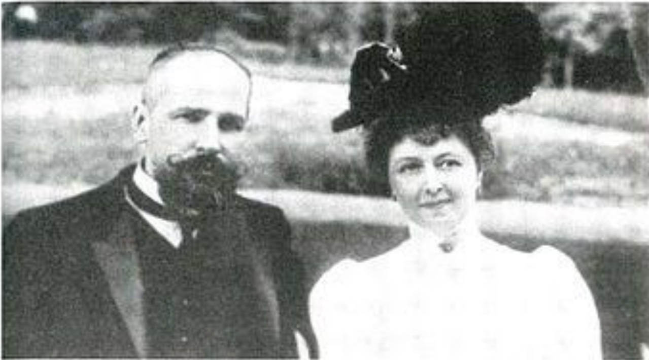
П.А.Столыпин — министр внутренних дел с супругой. 1906 год