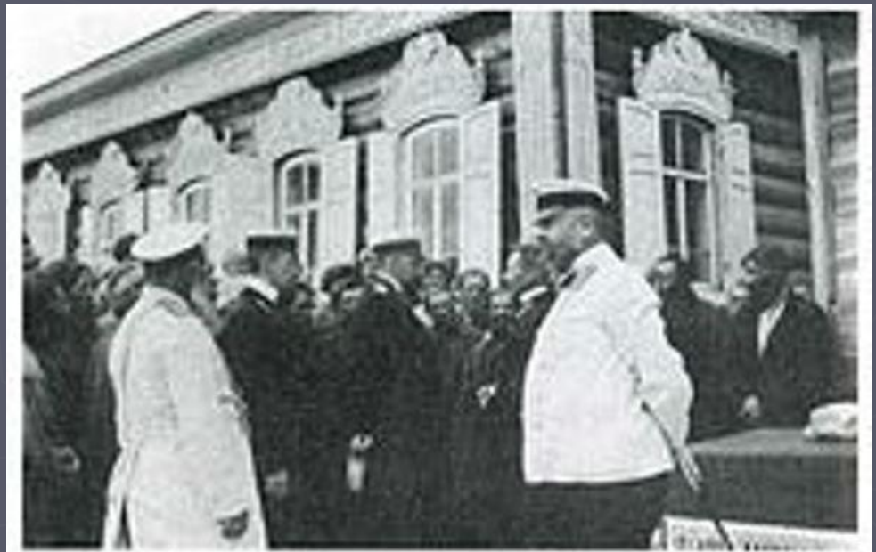
Станция Булгаковка Волыского уезда Саратовской губернии. Июль 1904 года

Назначение Столыпина саратовским губернатором в феврале 1903 года являлось повышением по службе и свидетельствовало о признании его заслуг на различных должностях в Ковно и Гродно. После поражения в войне с Японией страну захлестнули революционные события. При наведении порядка Столыпин проявлял редкое мужество и бесстрашие. Благодаря его энергичным действиям жизнь в Саратовской губернии постепенно успокаивалась. Император Николай II дважды выразил личную благодарность за проявленное усердие.