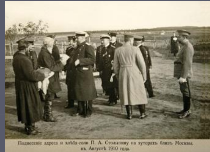
Поднесение адреса и хлеба-соли П. А. Столыпину на хуторях близ Москвы, июль-август 1910 года.

Б) Развитие капиталистических отношений в деревне, разрушение общины, передача крестьянам земли в частную собственность; создание хуторских и фермерских хозяйств;