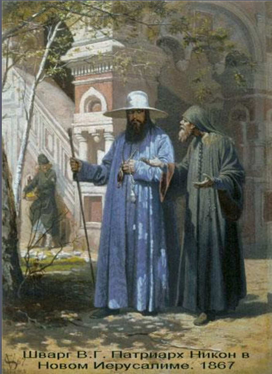
Шварг В.Г. Патриарх Никон в Новом Иерусалиме. 1867

25 июля 1652 года Никон был торжественно возведён на престол патриархов Московских и Всероссийских. Основал Новоиерусалимский монастырь в 1656 году. Провёл реформу церкви, в результате которой произошёл раскол.