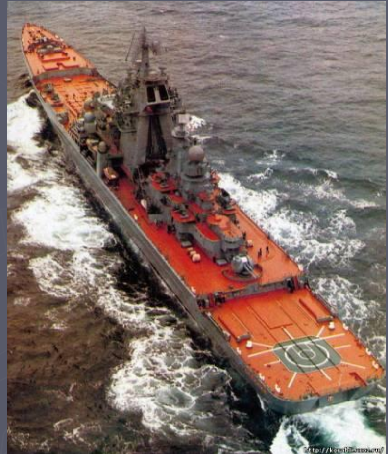
Крейсер «Адмирал Ушаков»