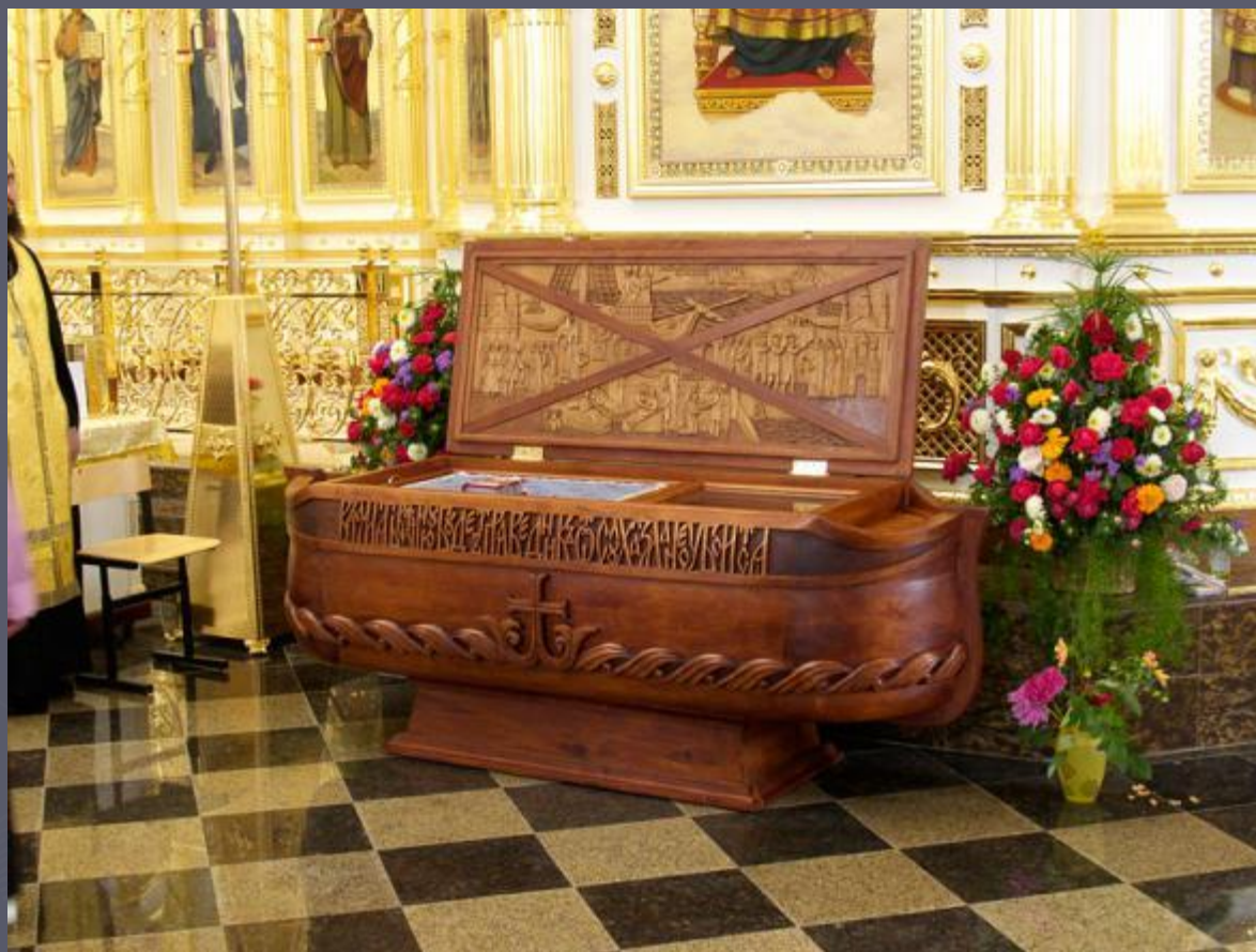
Могила Адмирала Ф. Ушакова в кафедральном соборе в Саранске