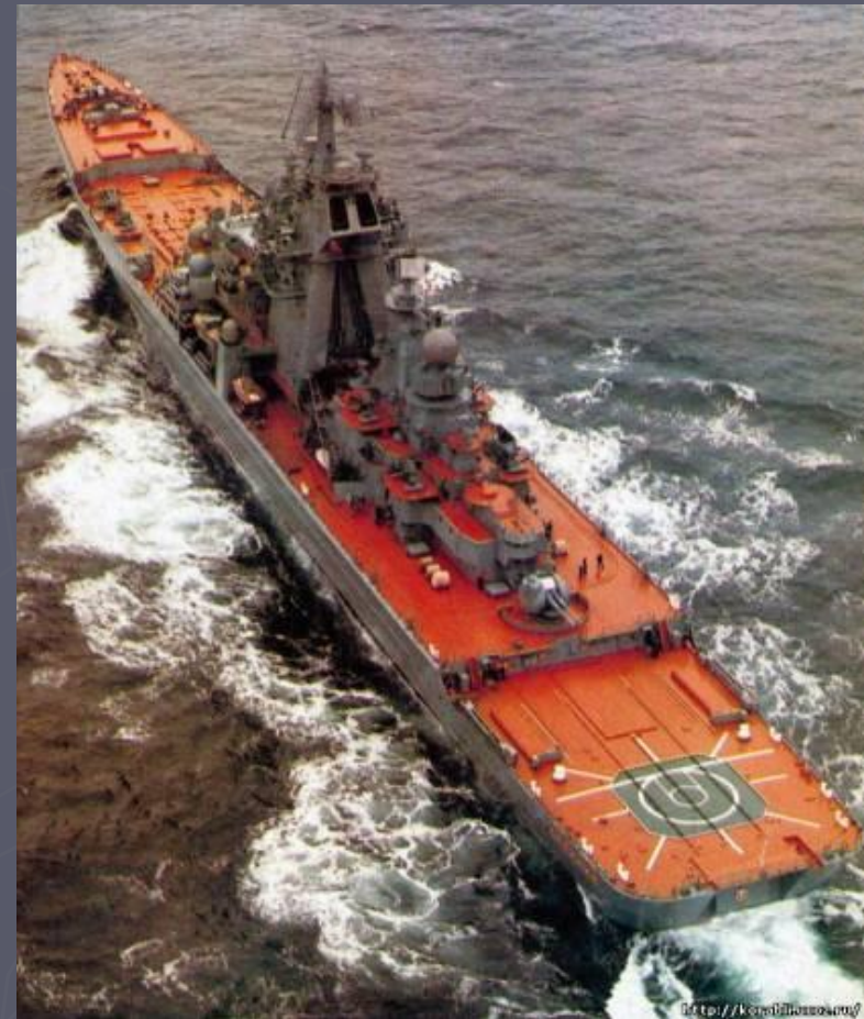
Крейсер «Адмирал Ушаков»