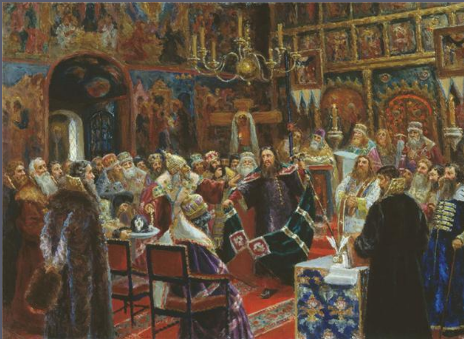
Суд над патриархом Никоном