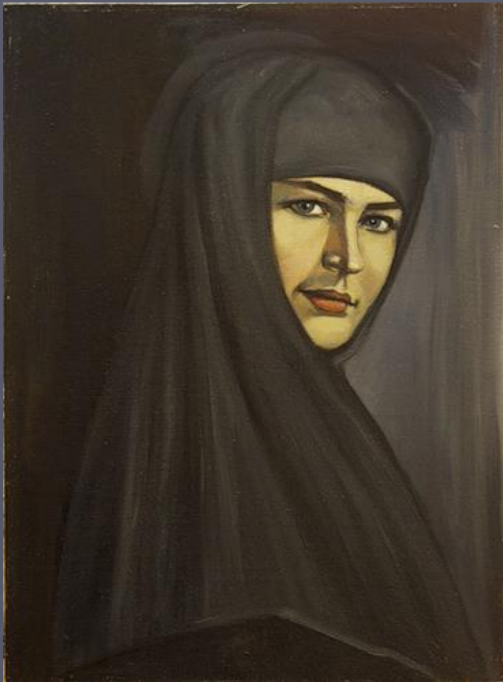
Алёна Арзамасская— женщина- атаман отряда во время крестьянского восстания под руководством С. Разина